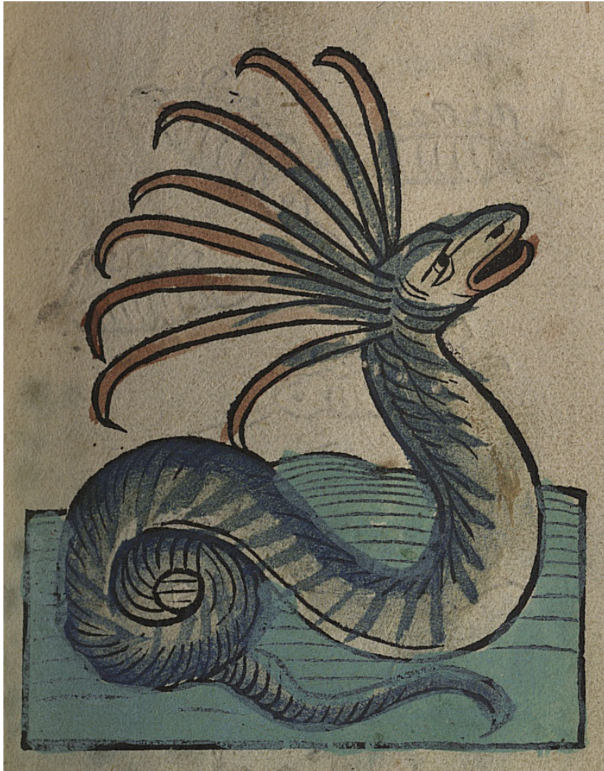
Cerastes. Hortus sanitatis. Mainz : Jacob Maydenbach, 1491

http://www.biusante.parisdescartes.fr/histmed/image?impharma_res005915x008