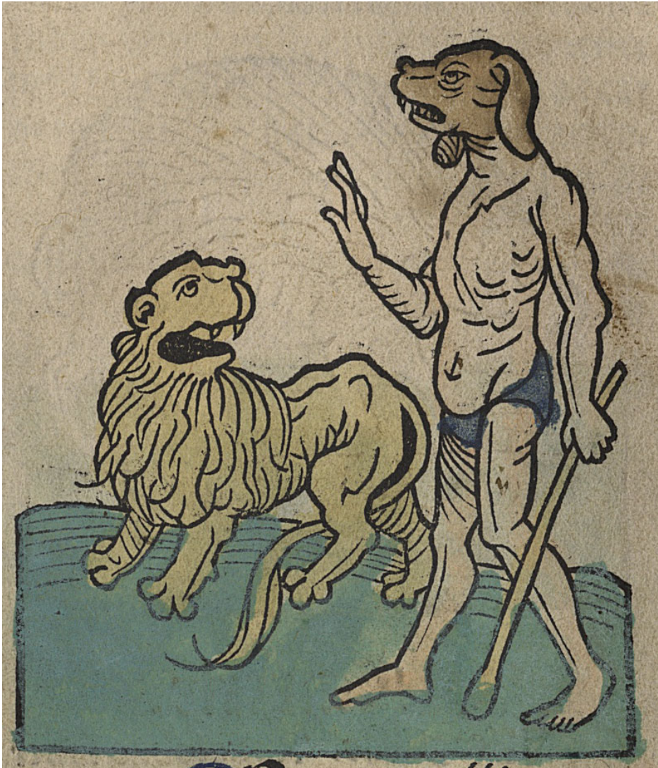
Cephus. Hortus sanitatis. Mainz : Jacob Maydenbach, 1491

http://www.biusante.parisdescartes.fr/histmed/image?impharma_res005915x008