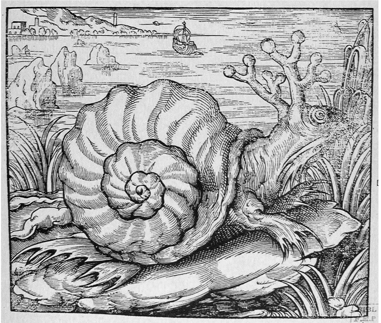
Figure du Limaçon de la mer Sarmatique. PARÉ, Ambroise. Les œuvres d'Ambroise Paré... divisées en vingt huit livres William. Paris : G. Buon, 1585

http://www.biusante.parisdescartes.fr/histmed/image?21221