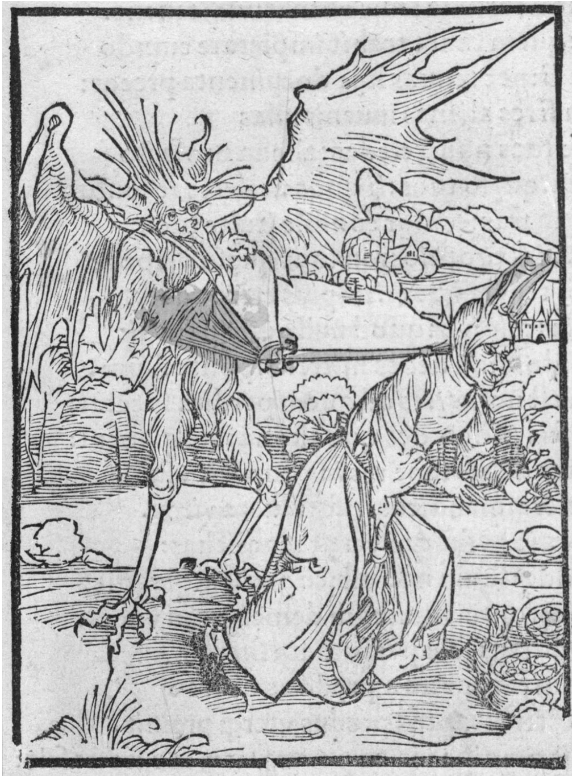
Rem alienam invenire et non reddere. BRANDT, Sebastian, Stultifera navis, Bâle : J. Bergman de Olpe, 1497

http://www.biusante.parisdescartes.fr/histmed/image?04396