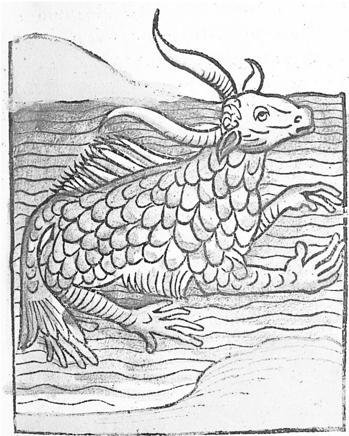
Hortus sanitatis. Mainz : Jacob Maydenbach, 1491

http://www.biusante.parisdescartes.fr/histmed/image?impharma_res005915x017