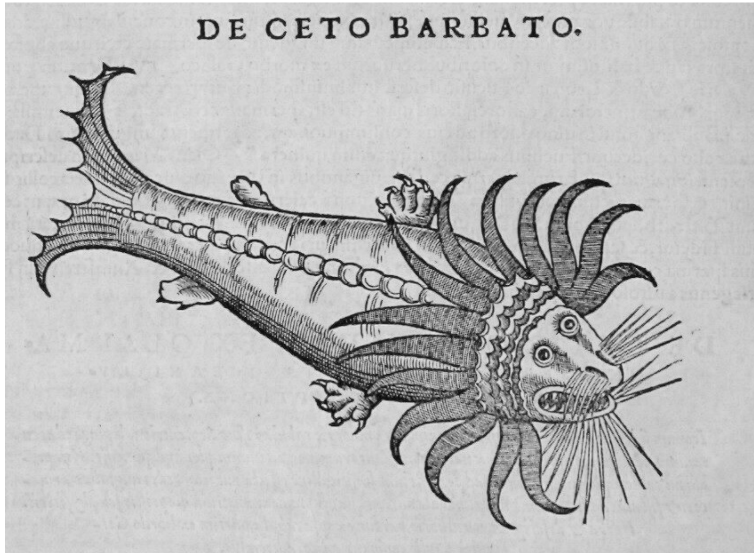
De ceto barbato. GESNER, Conrad. Historiae animalium.

http://www.biusante.parisdescartes.fr/histmed/image?21349