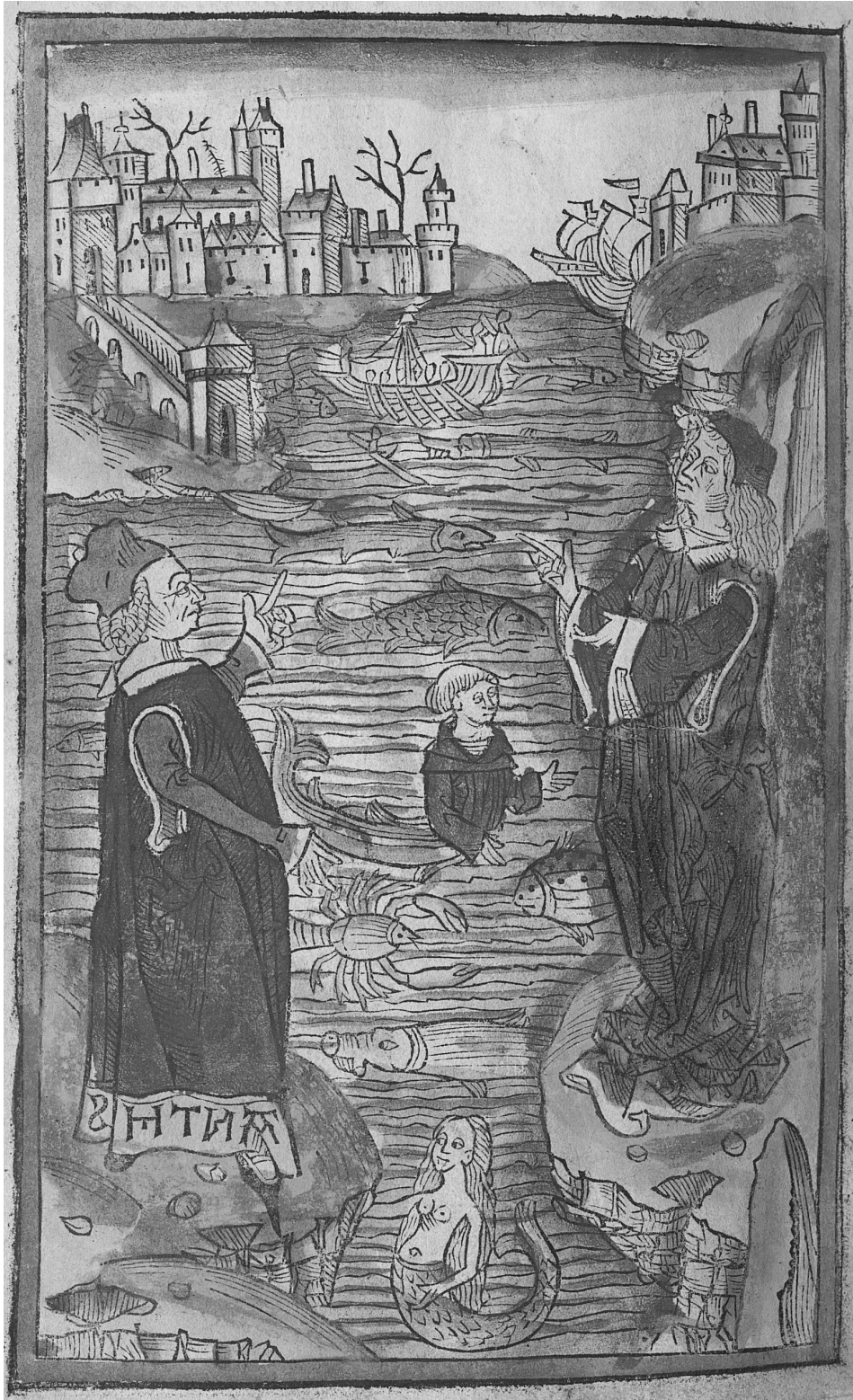
De piscibus. Hortus sanitatis. Mainz : Jacob Maydenbach, 1491

http://www.biusante.parisdescartes.fr/histmed/image?impharma_res005915x015