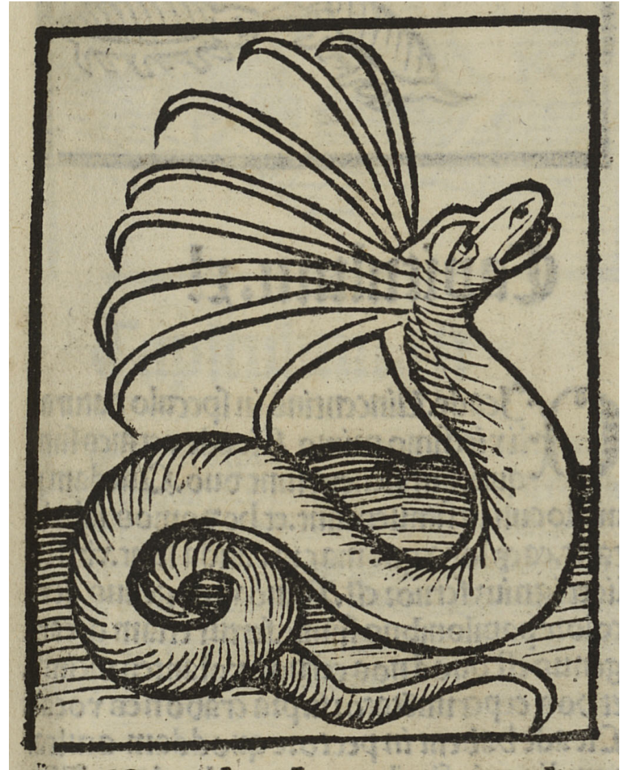
Cerastes. Johannes de Cuba. Hortus sanitatis, Strasbourg : Johannes Prüss, circa 1507

For more coloring pages, visit ColorOurCollections.org