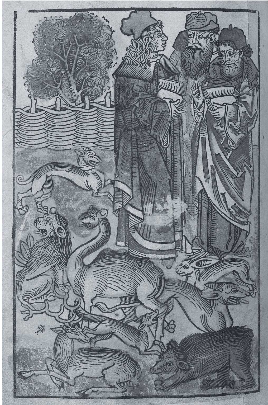
De animalibus, Hortus sanitatis, Mainz : Jacob Maydenbach, 1491

http://www.biusante.parisdescartes.fr/histmed/image?impharma_res005915x006