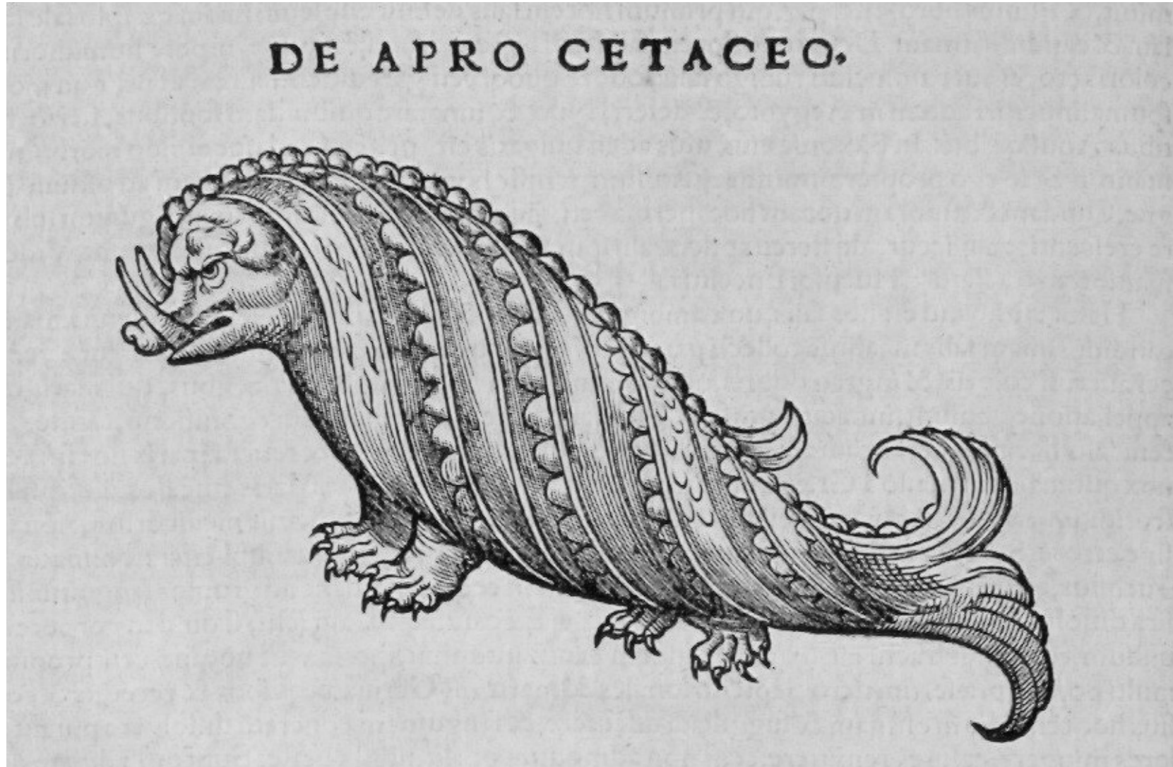
De apro cetaceo. GESNER, Conrad. Historiae animalium.

http://www.biusante.parisdescartes.fr/histmed/image?21349