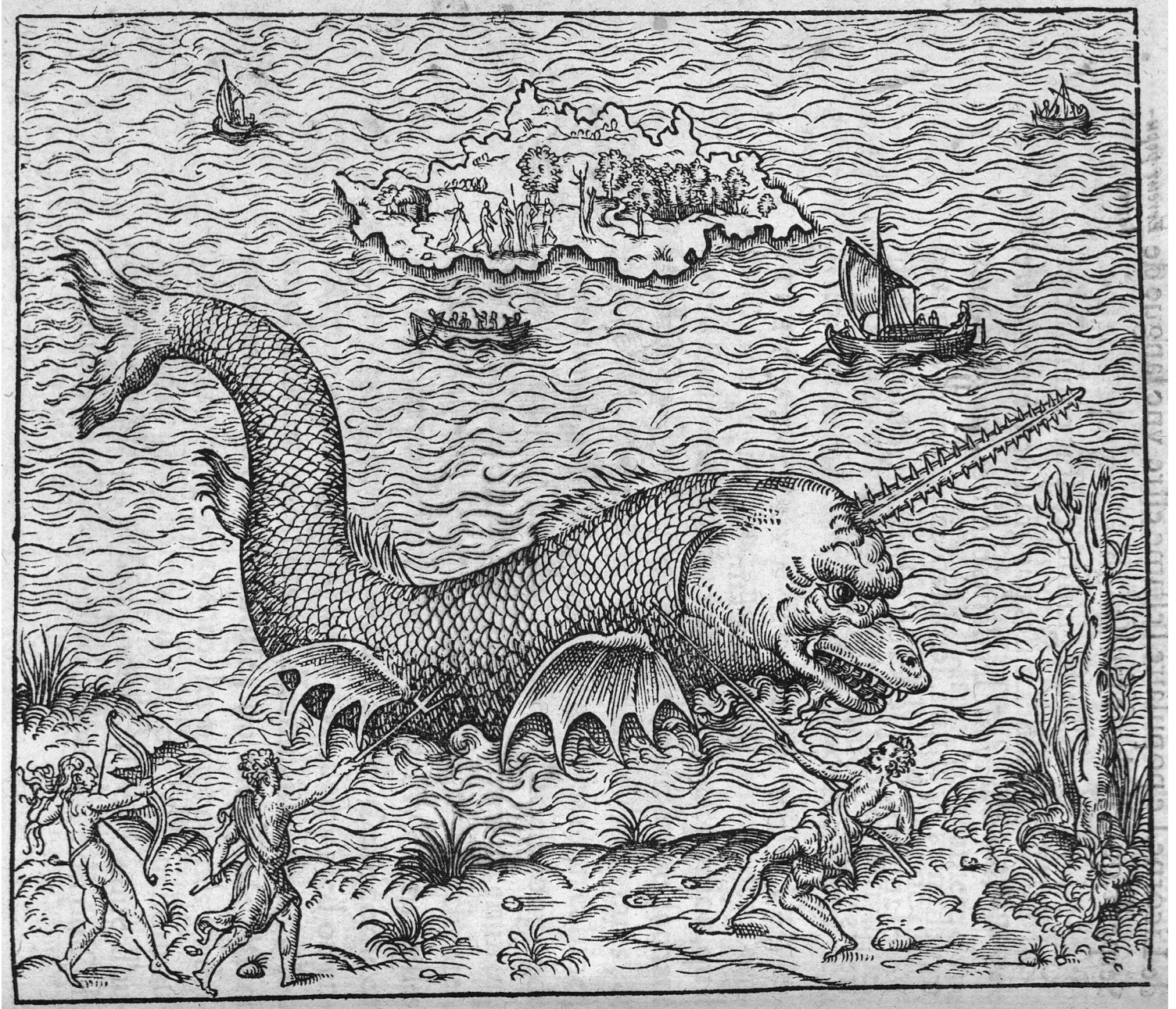
Poisson nommé Uletif, espece de Licorne de mer. PARÉ, Ambroise. Discours... de la mumie, de la licorne, des venins et de la peste. Paris : Gabriel Buon, 1582

http://www.biusante.parisdescartes.fr/histmed/image?med06290x0094