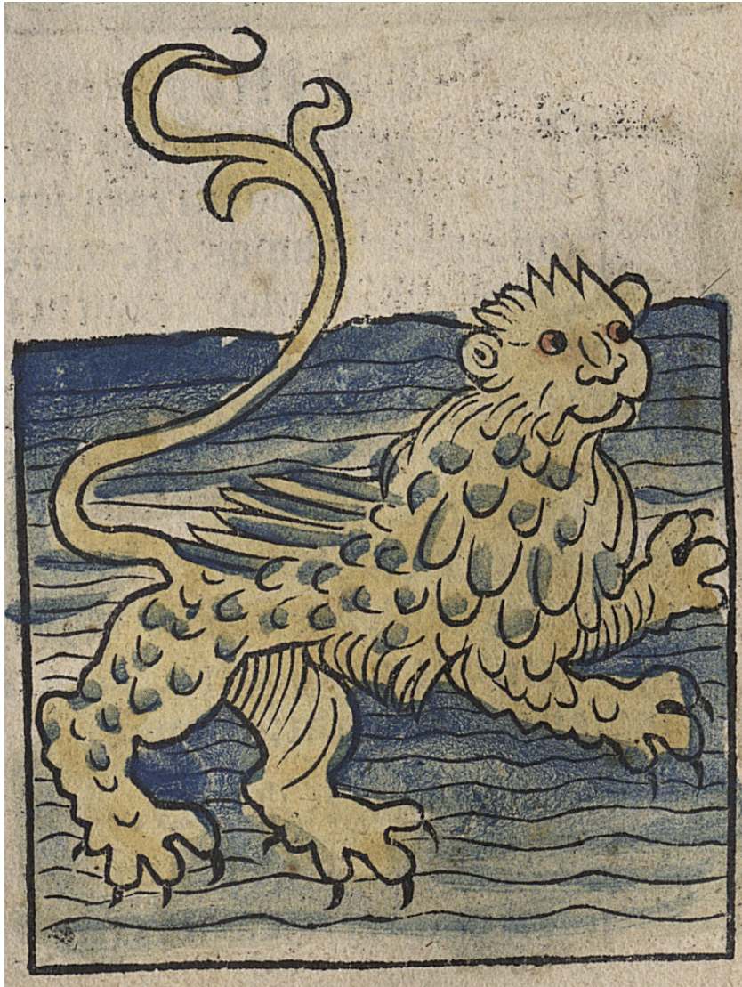
Leo marinus. Hortus sanitatis. Mainz : Jacob Maydenbach, 1491

http://www.biusante.parisdescartes.fr/histmed/image?impharma_res005915x017