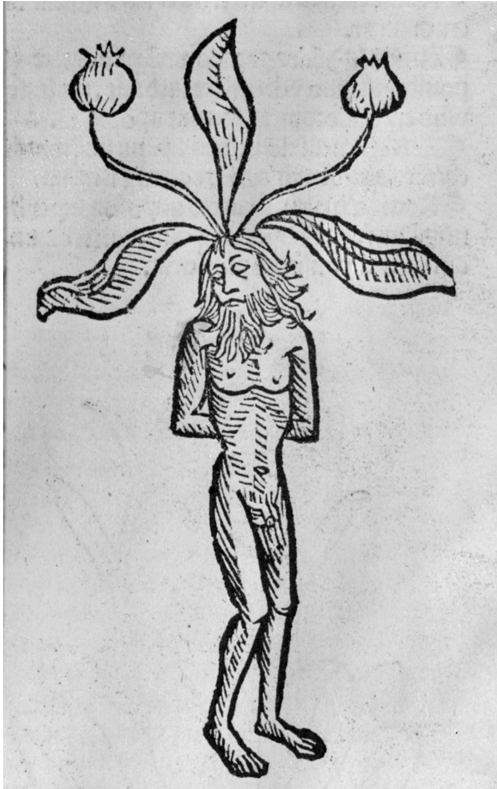
Mandragore mâle. CUBA, Joannes / CUBA, Johann von. Hortus sanitatis, 1499

http://www.biusante.parisdescartes.fr/histmed/image?01006