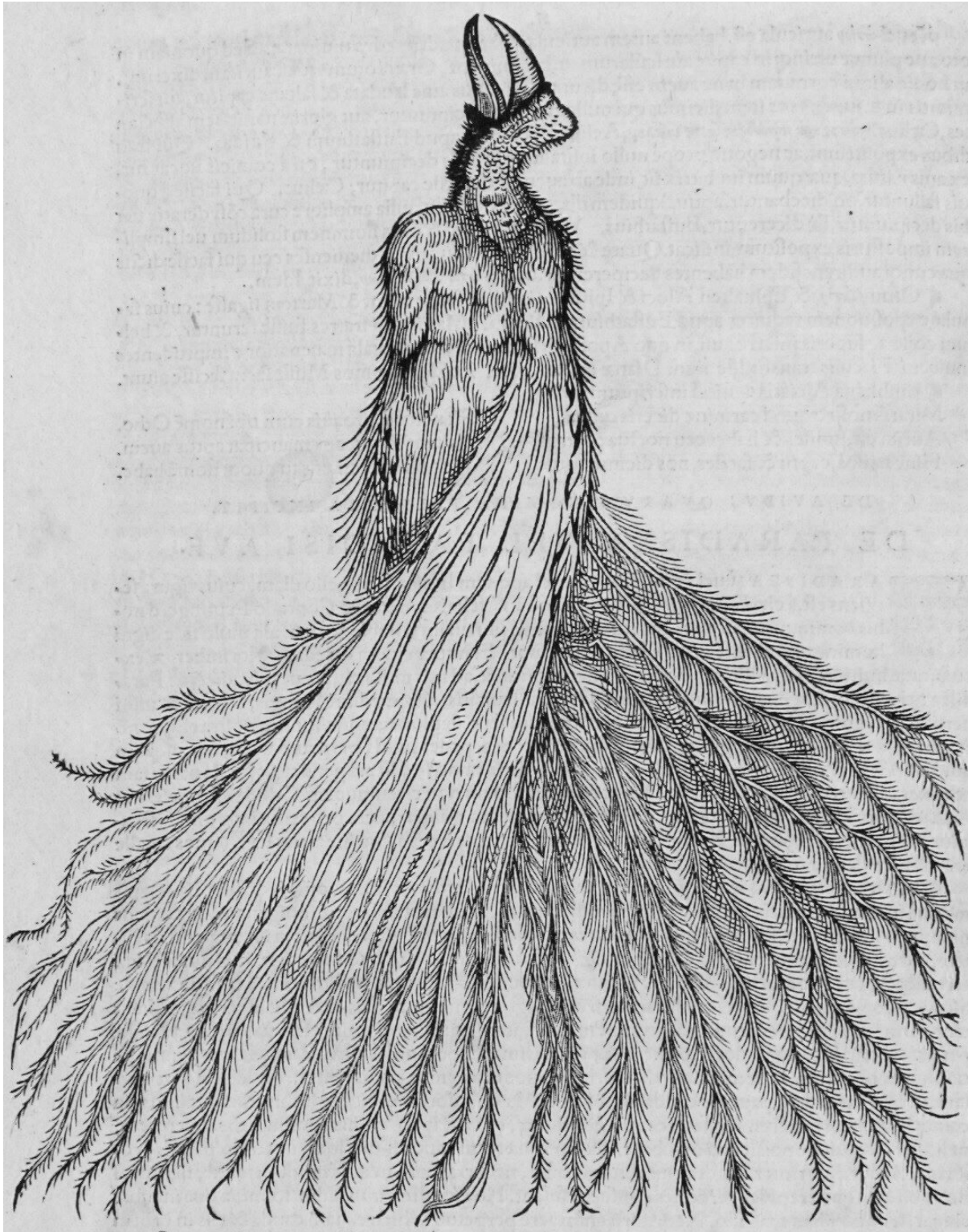
[L'oiseau de paradis] De Auibus. GESNER, Conrad. Historiae animalium . 1551-1553

http://www.biusante.parisdescartes.fr/histmed/image?21360