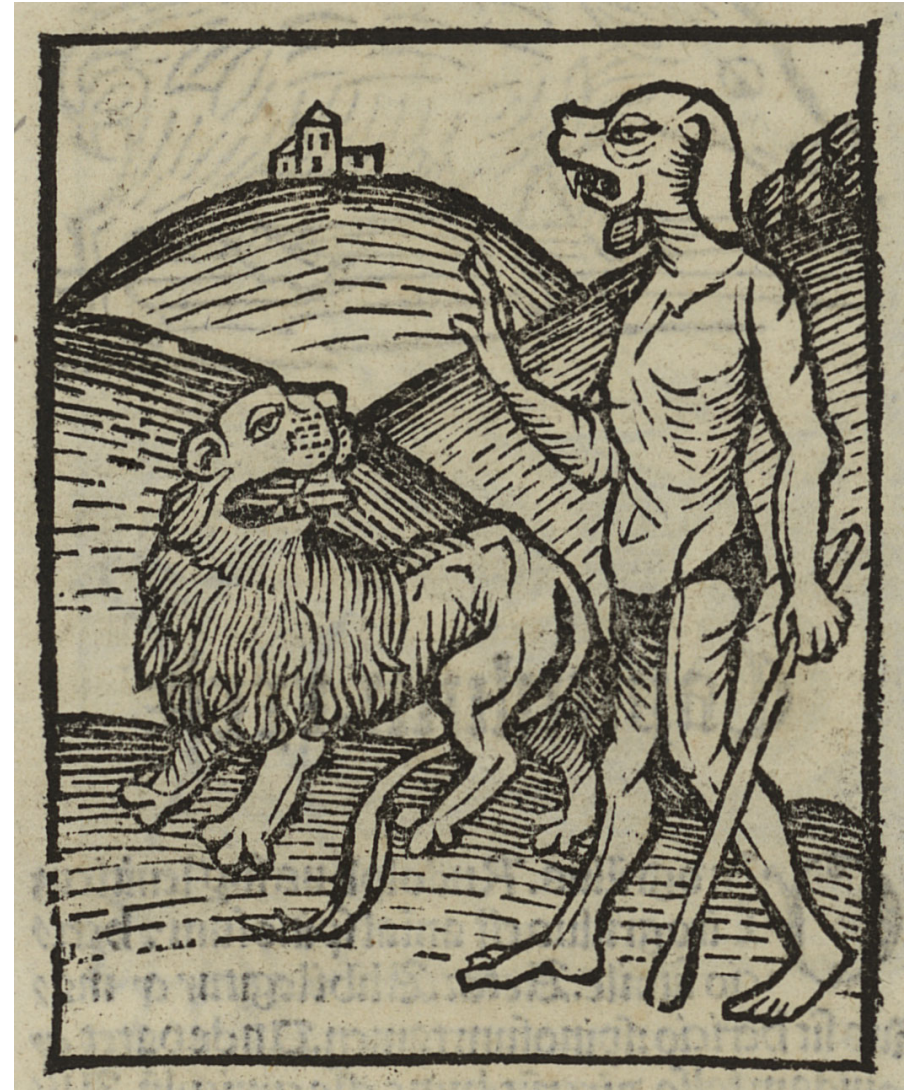
Cephus. Johannes de Cuba. Hortus sanitatis, Strasbourg : Johannes Prüss, circa 1507

For more coloring pages, visit ColorOurCollections.org