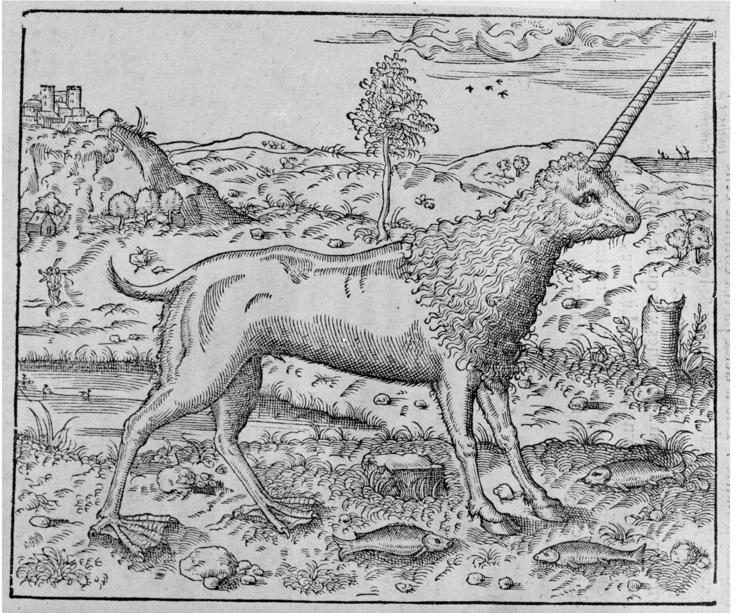
Figure du camphur. PARÉ, Ambroise. Discours... de la mumie, de la licorne, des venins et de la peste. Paris : Gabriel Buon, 1582

http://www.biusante.parisdescartes.fr/histmed/image?00935