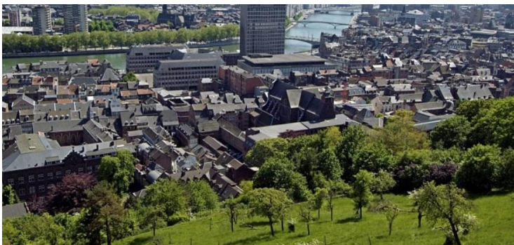
Citadelle de Liège

Charleville-Mézières – Rocroi : 26,1 kms