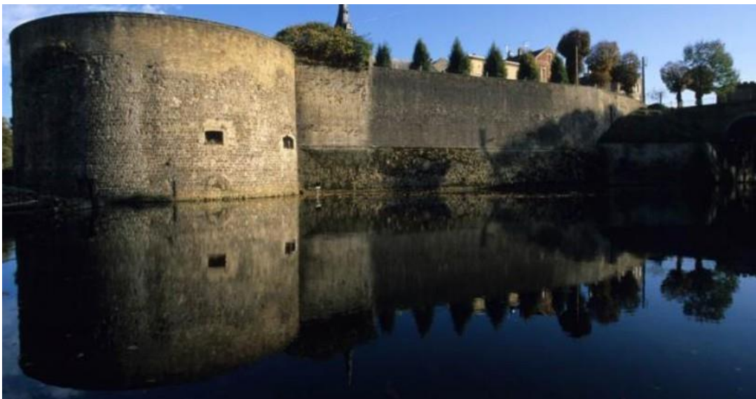
Citadelle de Charleville-Mézières