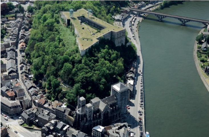
Citadelle de Huy