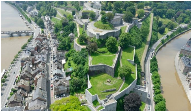
Citadelle de Namur