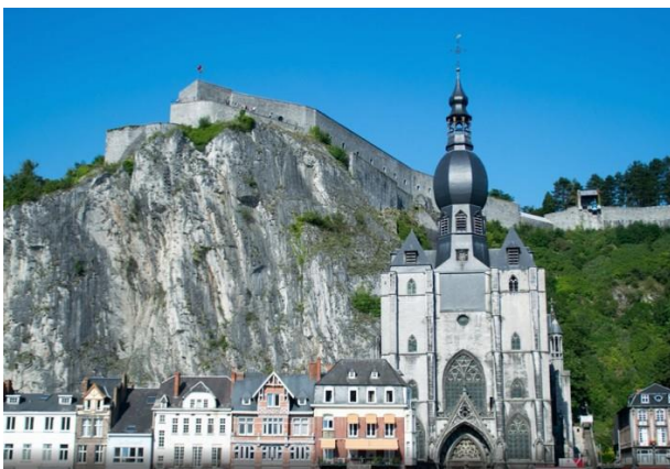
Citadelle de Dinant