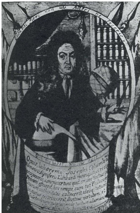
Fig. 7. Portrait de Giuseppe Colombani. Gravure (Coll. part.).