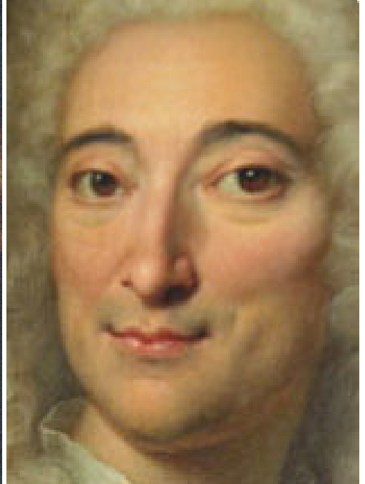
Fig. 12. Visage 2. © Xavier Deltombe.

celle de Scotin, sont d'une facture nettement moins bonne. La première est celle du frontispice de l'édition allemande du Chirurgien Dentiste datant de 1733. La seconde, datant du XIXe siècle, était vendue aux nouveaux abonnés de L'Abeille, Journal des Dentistes , en 1865 et la troisième, différente par ses dimensions est celle que Viau posséda et dont nous n'avons pas de reproduction. Une mandibule est posée sur la table, seul détail différent de la gravure de Scotin selon Viau (Viau, p. 10). Tiré de la gravure de 1728, un portrait de Fauchard est présenté sur la première de couverture du livre de Besombes et Dagen en 1961.