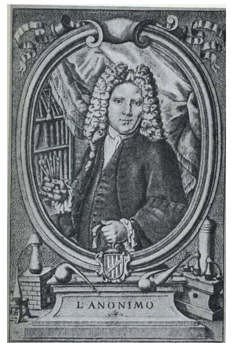
Fig. 6. Portrait de Buona Fede Vitali. Gravure (Coll. part.).