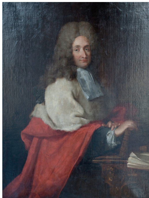
Fig. 5. Portrait de Nicolas de Lamoignon.