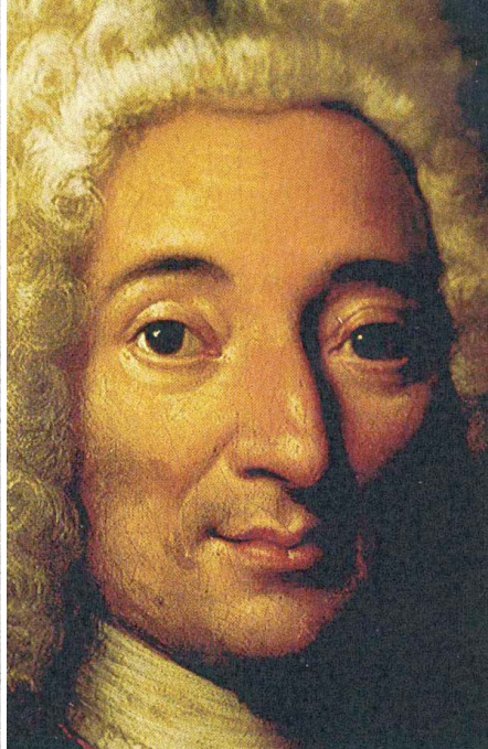
Fig. 11. Visage 1. © Xavier Deltombe.