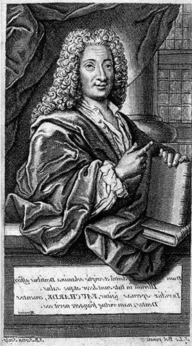
Fig. 10. Portrait de Pierre Fauchard. Gravure retournée. Frontispice.