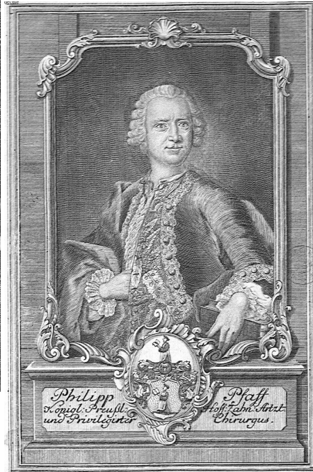
Fig. 2. Portrait de Philipp Pfaff. Gravure. Frontispice de son Traité de 1756.