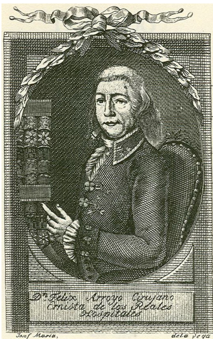
Fig. 4. Portrait de Don Felix Perez Arroyo. Frontispice de son Traité de 1799.