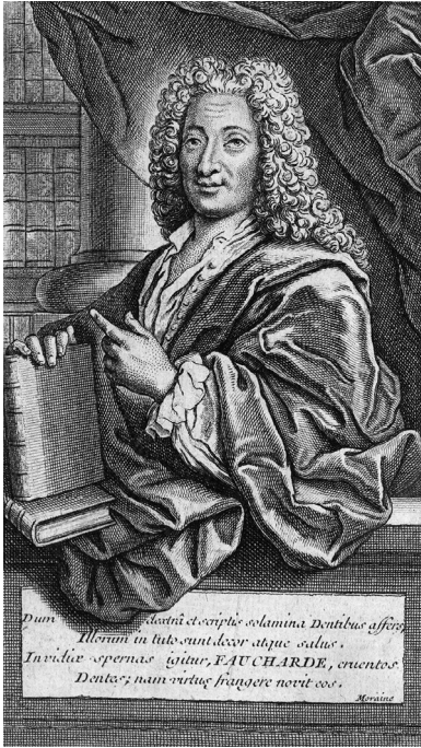
Fig. 1. Portrait de Pierre Fauchard. Gravure. Frontispice des trois éditions de son Traité .