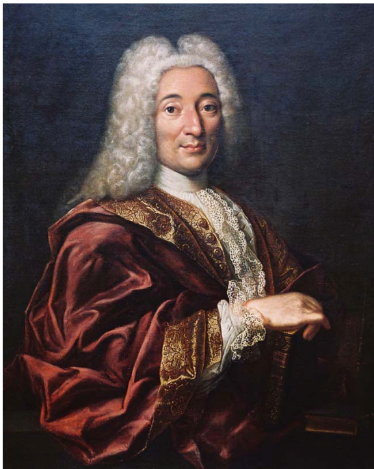
Fig. 8. Portrait 1 de Pierre Fauchard "au col fermé". Huile sur toile. © Xavier Deltombe (Coll. part.).