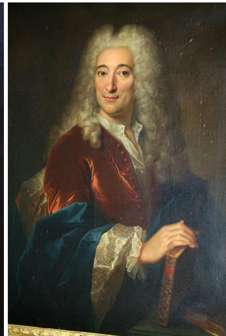
Fig. 9. Portrait 2 de Pierre Fauchard "au col ouvert". Huile sur toile.