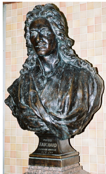
Fig. 13. Buste en bronze de Pierre Fauchard. Musée de l'APHP.

En plus des peintures, gravures et sculptures les médailles sont une autre façon de représenter Fauchard. Il en existe quatre, deux réalisées au XXe siècle, celle de la Pierre Fauchard Academy et celle de l'ONCD, et deux en ce début du XXIe siècle diffusées en 2011 à l'occasion de la célébration du bicentenaire de sa mort, l'une par la SFHAD et l'autre pour la même raison par la Pierre Fauchard Academy France. Toutes ces médailles sont en alliage, excepté la dernière citée qui est en terre cuite.