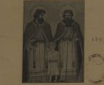
St-Denis et St-Dionis