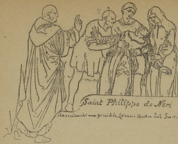
Saint Philippe de Néri récorisant une possédée, (d'après André del Sarte)