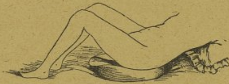
Figure N° 2

Le Bassin “EXCELOR” peut servir de bidet