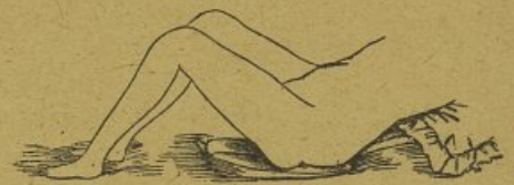
Figure N° 3