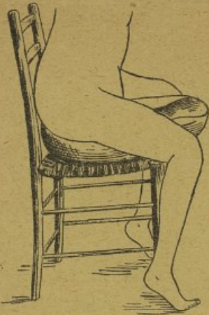
Figure N° 1

6° La forme du siège anatomique permet un séjour, même prolongé, sans gêne ni risque de blessure (fig. n° 2), comme cela se produit souvent dans les Bassins dits “forme pelle” (fig. n° 3).