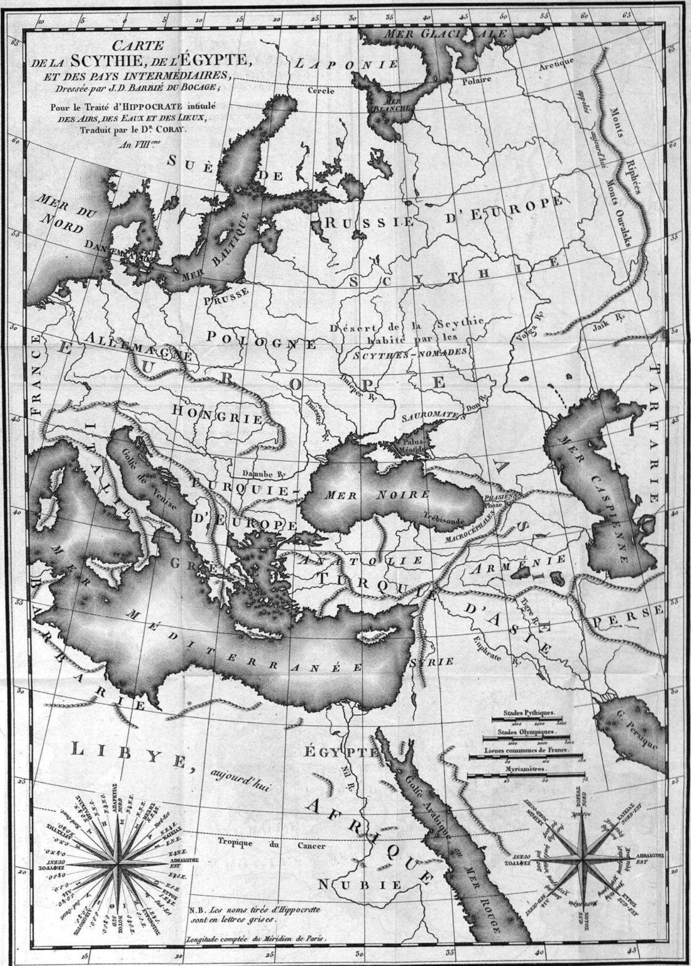
Gravé par F.F. Tardieu, Place de l'Estimade N° 18.