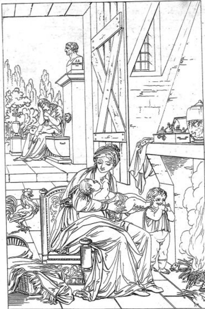
C. Guis. sculp. int.