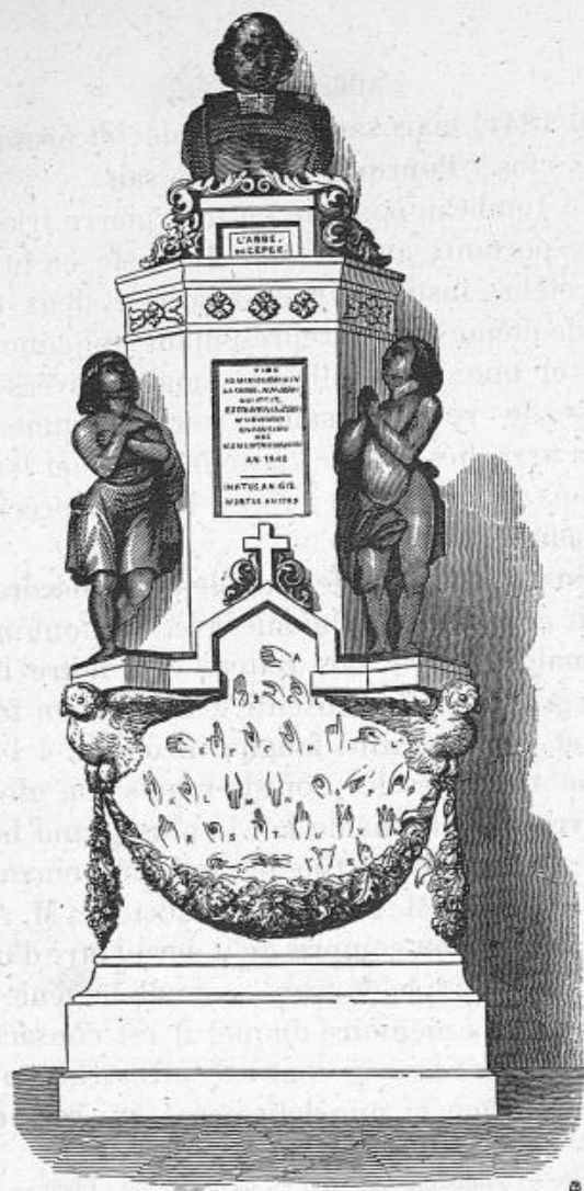
Monument de l'abbé de l'Épée dans une chapelle de l'Eglise Saint-Roch, à Paris.

Sculpteur, M. PRÉAULT. - Architecte, M. LASSUS.