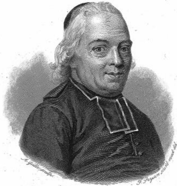
L'ABBÉ DE L'ÉPÉE.

Après la mort de l'abbé de l'Épée, le silence se fit.