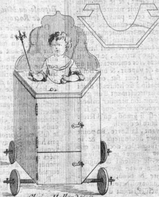
Chaise Hollandoise ou Cack-Stoel.

Notez que la chaise n'est pas aussi haute qu'elle le paroît dans cette gravure.