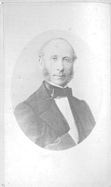
1809—D r A. PERRIER—1866