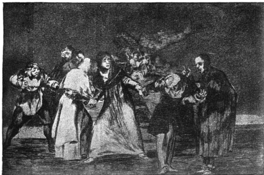
Une page de Goya

Soc. fr. d'Hist. de la Médecine, 1905. Pl. IV.