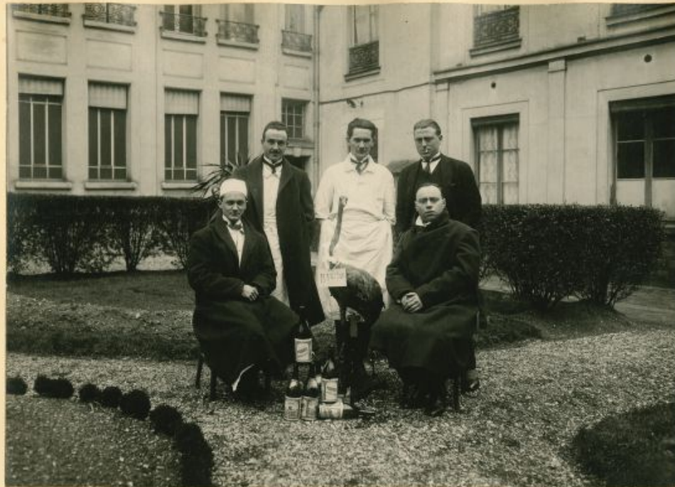
Cliché Pirou. 28, Rue Royale

LICHWITZ THEILLIER GUEDE BIZE MARTINEAU (Abent) BLUM (Gaston)