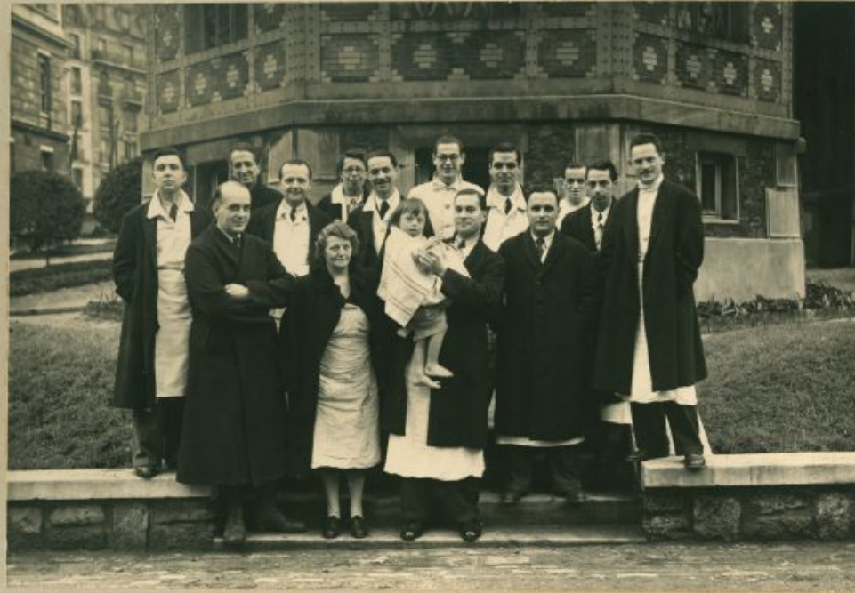
VEYRIERES M re TISSERAND M re CHEZZI Ed. MASMONTEIL CHASSAGNE M re KERBRAT CHARROUX Ed. TIXIER PETIT LAFOURGADE CHOUBRAC LEJEUNE Ed.