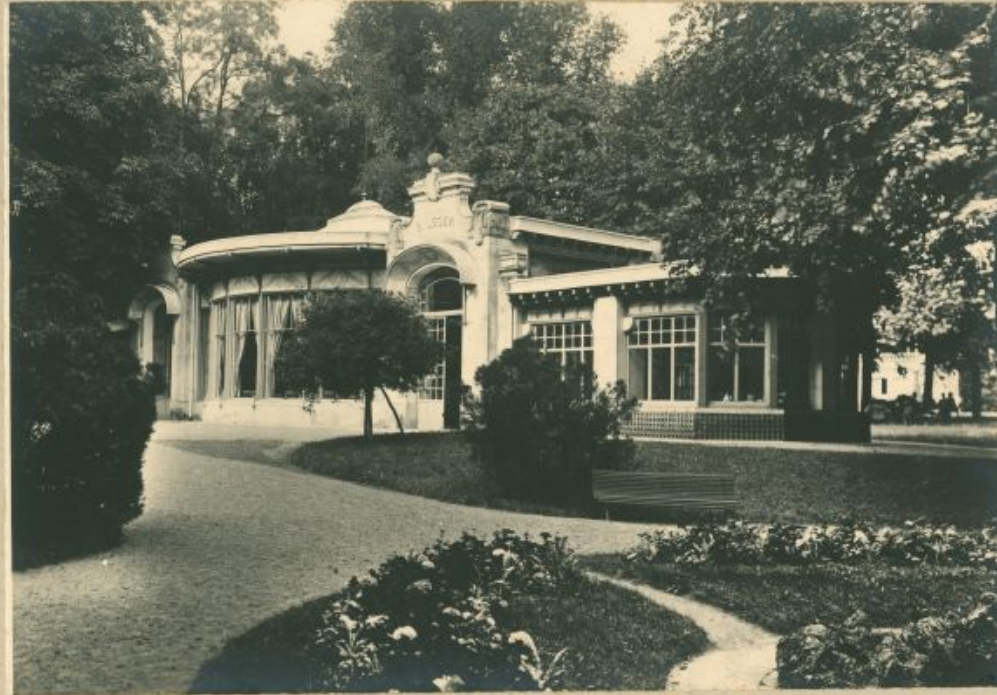
PAVILLON DES SOURCES