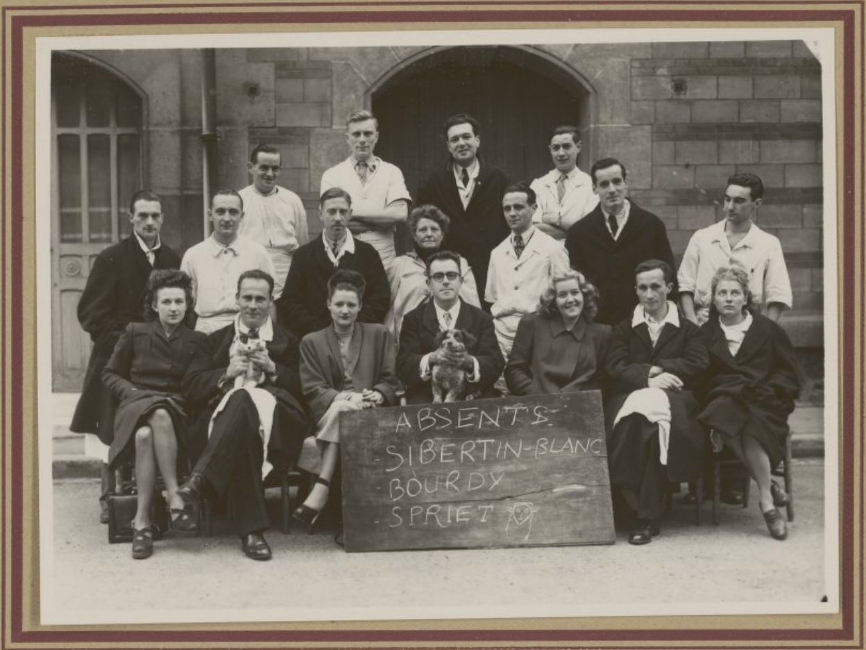
THIERRART (Ext. en pr.)