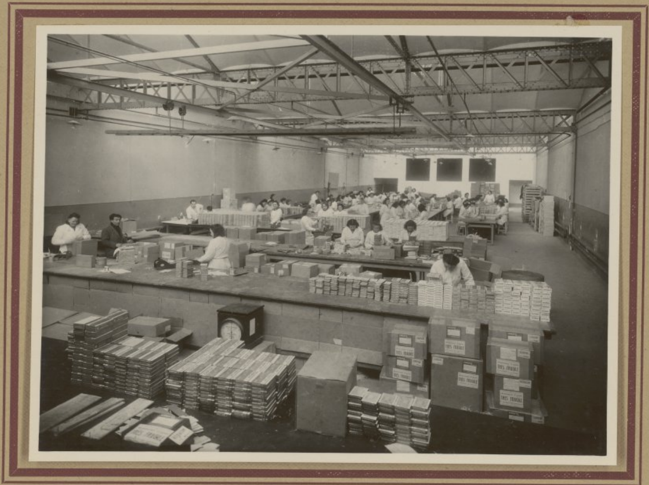
Atelier de Conditionnement