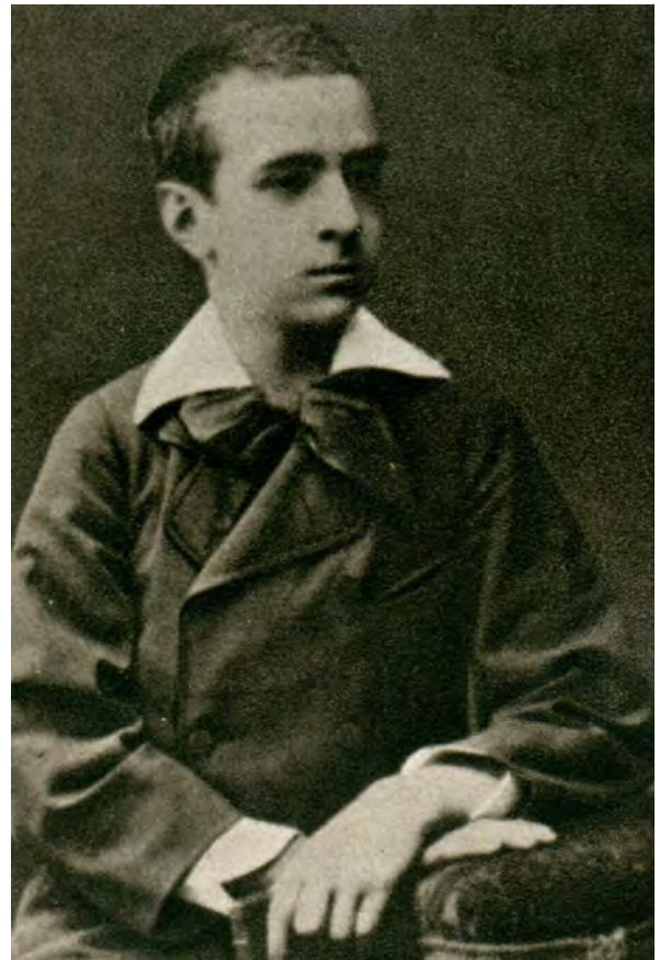
Fig. 13. Portrait de Jean-Baptiste Charcot, vers 15 ans.

La partie consacrée à Jean-Baptiste, le futur navigateur, est plus étoffée, avec un portrait sensible et imagé traduisant la grande amitié qu'elle avait pour lui : « Il demeura jusqu'à la fin de sa vie qui fut, l'on s'en souvient tragique 8 , le Jean de mon enfance, simple et bon, sans aucune pose, outrant au contraire sa rudesse et son allure de bon garçon sans gêne. Déjà il adorait la mer, les marins et les pêcheurs ; presque toutes les photographies