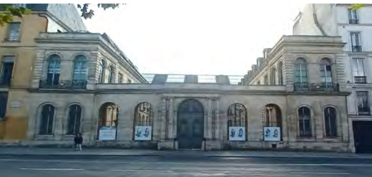
Fig. 5. Façade actuelle de l'hôtel de Chimay, sur le quai Malaquais. Les Charcot disposent du petit balcon côté Seine, au premier étage à gauche.