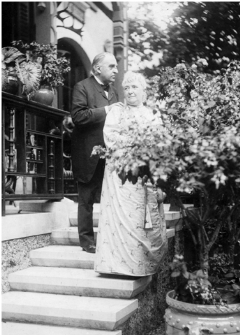
Fig. 1. Jean-Martin Charcot dans leur jardin de Neuilly (vers 1885).