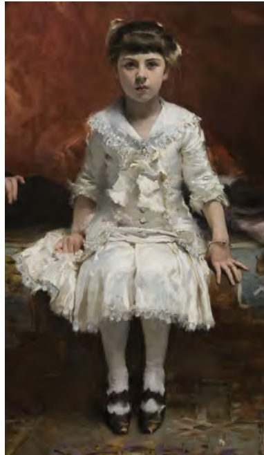
Fig. 2. Marie-Louise Pailleron, par John Singer Sargent (1881) : détail du portrait où elle est représentée avec son frère (Cf. Fig. 10).