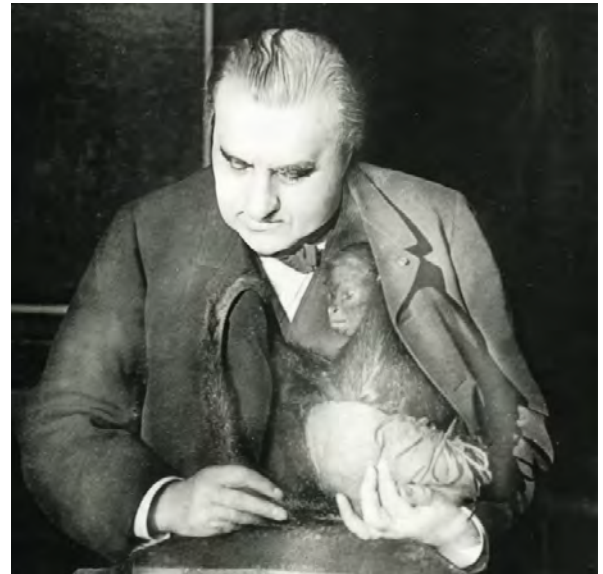
Fig. 19. Le Dr Charcot, avec sa guenon Zibidie.

Rosalie) : « J’ai connu aussi Rosalie, grande guenon noire avec gilet blanc, offerte au Professeur par l’Empereur du Brésil, celle-ci agrémentée d’une longue queue prenante en point d’interrogation, au moyen de laquelle elle se suspendait aux lustres. Comme l’appartement était très élevé de plafond, les visiteuses assises dessous ne voyaient pas Rosalie, qui choisissait avec soin son point de chute et se laissait tomber mollement au moment opportun sur les genoux d’une dame justement effarée. Combien de fois ai-je, de mon coin, contemplé ce spectacle et avec quelle joie toujours nouvelle, inutile de le dire. » (Fig. 19)