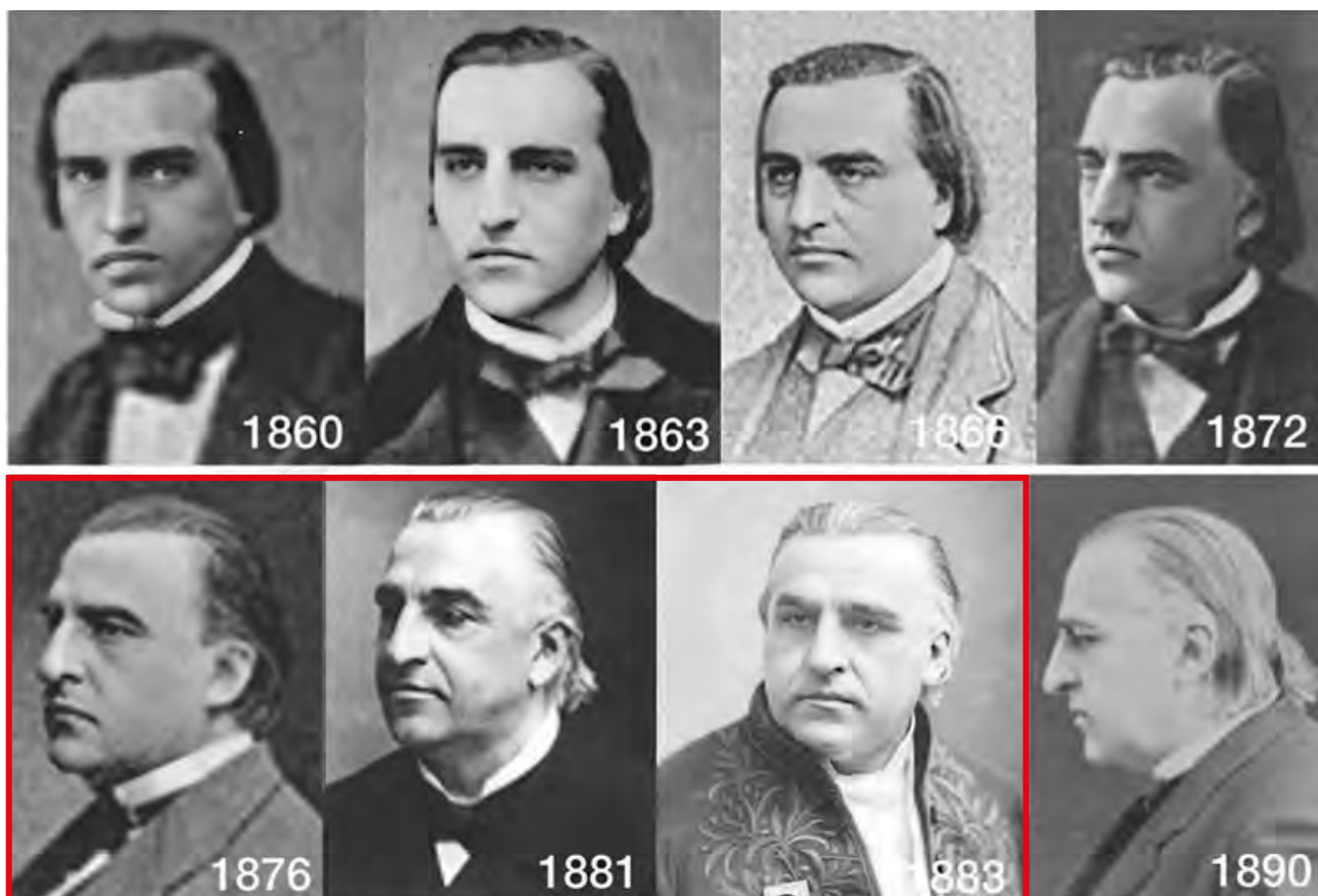
Fig. 12. Montage de photos de Charcot aux différents âges de sa vie.

Les trois photos encadrées correspondent à l'époque où il résida à l'Hôtel de Chimay, entre 1875 et 1884.