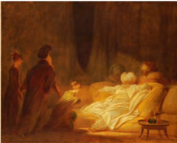
Fig. 11. Le Pacha , par Jean-Honoré Fragonard (1732-1806).

d'une résille emperlée, mais le sein nu. Je me souviens surtout d'un beau pacha ventru tout habillé de blanc accroché au-dessus du divan sur lequel s'asseyait Madame Charcot. Ne fumait-il pas une pipe, ce Pacha ? Je n'en suis pas sûre, toutefois ce tableau me plaisait, plus qu'aucun autre. Sur un fond assombri, le blanc crémeux de la robe était d'une douceur si moelleuse que j'eusse aimé en caresser l'étoffe » (Fig. 11). Ce fameux Pacha , œuvre de Fragonard, sera cédé plus tard, par Jean-Baptiste Charcot, qui lui avoua un jour « l'avoir vendu pour acheter une propriété en Bretagne qui (lui) plaisait beaucoup. » 7