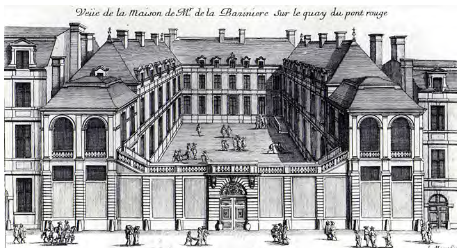
Fig. 4. L'Hôtel de la Bazinière, au XVII e siècle. Perspective gravée par Jean Marot (vers 1658).

cousine de Joséphine de Beauharnais à partir de 1808. Joseph de Riquet de Caraman, prince de Chimay (1808-1886), diplomate et industriel belge, fils aîné de Thérèse Cabarrus, dite Madame Tallien , le rachète en 1852. Il y habite une partie de l'année avec sa famille, en occupant le rez-de-chaussée 2 , tout en louant les appartements de l'étage. À la suite d'un krach boursier en 1882, le prince de Chimay met en vente le bâtiment, qui est racheté par l'État en 1883 pour en faire une annexe, côté Seine, de l'École nationale des Beaux-Arts.