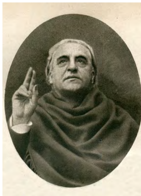
Fig. 17. Jean-Martin Charcot en Dieu le père.