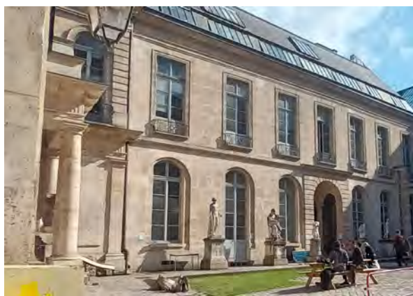
Fig. 6. Vue de la cour. Les fenêtres du premier étage à gauche sont celles des Charcot, avec, au même étage sur la droite, celles des Pailleron.