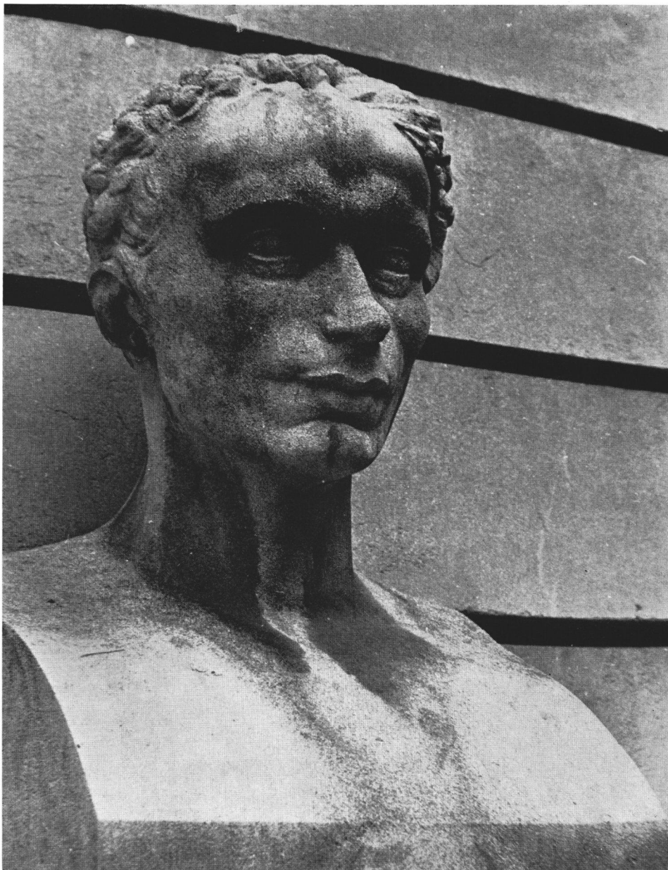
LAENNEC Buste du Collège de France (Cour Budé).