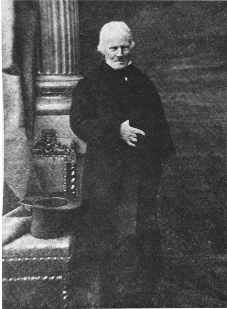
Fig. 3. — Photographie de Villermé âgé.