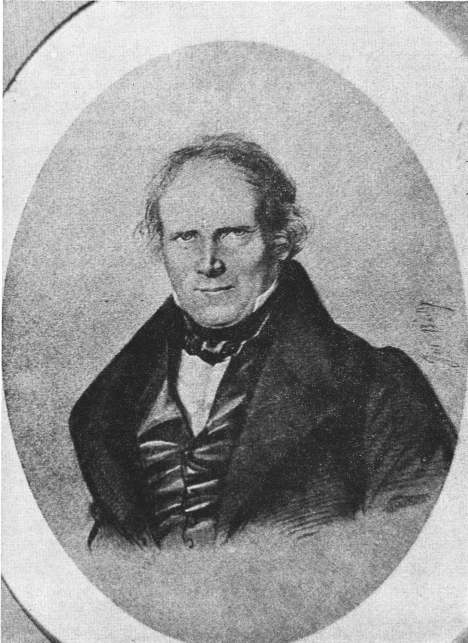
Fig. 1. — Portrait de Villermé par Boilly. (Collection de La Serre).