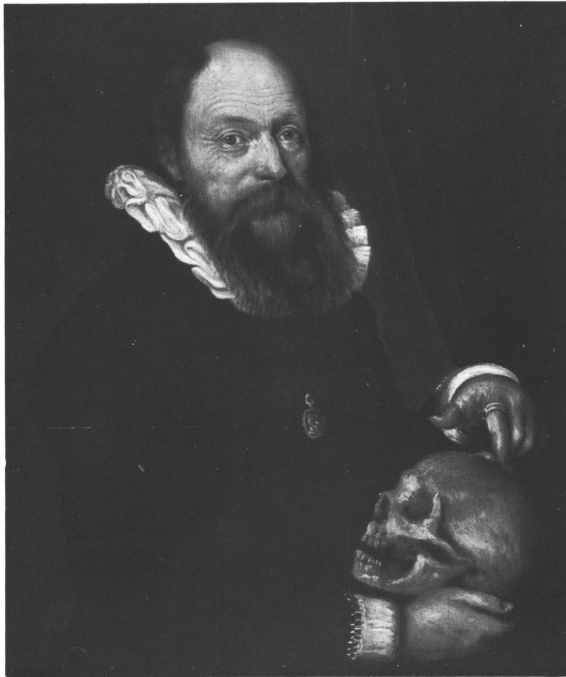
Universität Bern. Medizinische Fakultät. Peinture à l'huile attribuée à Bartholomäus Sarburgh.