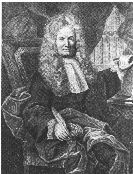
Raymond Vieussens Con. et Medecin du R.

Médecin et historien de la médecine, je connaissais le nom de Raymond Vieussens. Je gardais souvenance en particulier des formations anatomiques du système nerveux central auxquelles son nom demeure attaché. Je n'ignorais pas non plus qu'il fut l'un des premiers anatomistes et l'un des rares bons cliniciens de son temps.