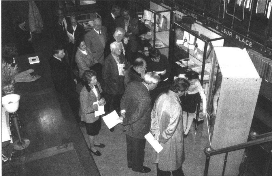
Exposition Baillière à la BIUM