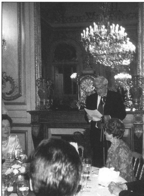
Dîner dans le salon de Boffrand du Palais du Luxembourg