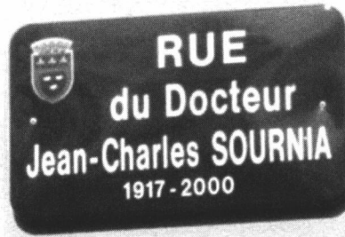
La rue Sournia

et l'ancienne rue Alexis Carrel, cette dernière a été rebaptisée, au cours de la même séance, en Rue Adélaïde Hautval, Médecin, Déportée Résistante (1906-1988), plusieurs associations ayant sollicité cette modification. La rue du Docteur Jean-Charles Sournia, est longée d'un côté par un immeuble neuf en fin de construction (avec des commerces) et de l'autre, par un petit jardin avec un toboggan pour enfant. La création de cette nouvelle rue à Bourges est également mentionnée à la page 4 d'un extrait de la revue Le Point (numéro spécial 1687 intitulé : Bourges, la métamorphose et daté du 13 janvier 2005 : Bourges nord va connaître un spectaculaire changement d'habitat... Des voies ont été créées pour faciliter la circulation comme la rue du Docteur Jean-Charles Sournia qui longe le jardin public et qui dessert l'entrée principale des logements et des commerces, la rue du Docteur René Lançon et la rue Adélaïde-Hautval (anciennement rue Alexis Carrel prolongée).