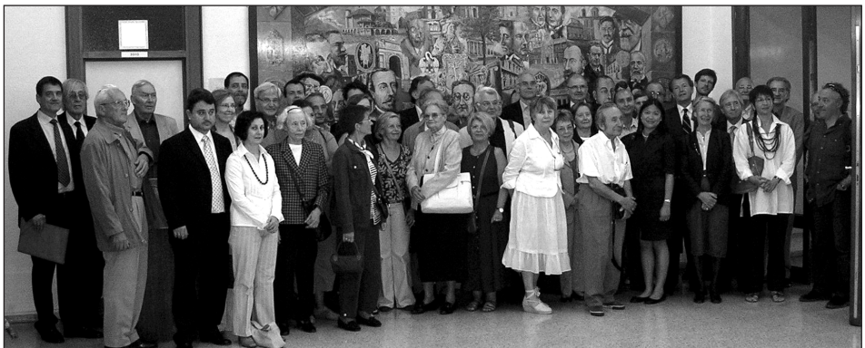
Le groupe des participants à nos Journées devant la fresque des célébrités médicales du Pays Basque, ornant l'entrée du musée d'histoire de la médecine basque (Leioa, Biscaye).

Cela étant, ce voyage au pays du "peuple qui chante et qui danse au pied des Pyrénées" (Voltaire) ne se trouvait pas dépourvu de fondement. Ici aussi, en Pays Basque Nord,