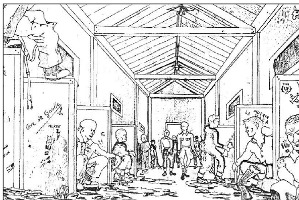
Vie quotidienne au camps. Dessin de Maurice Chauvet (réf. 3)

rhéique endémique au camp de Miranda. Morin indique que les autorités espagnoles firent construire une nouvelle baraque qui entra en fonction fin octobre mais elle était située proche de la première et surtout, comme la précédente, elle pouvait difficilement être atteinte de nuit par les dysentériques qui se soulageaient précipitamment dans les passages entre les baraques. Le manque d'eau et le découragement qui gagnait rapide-