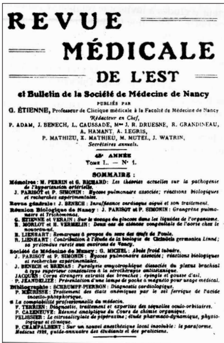
Page de couverture de la Revue médicale de l'Est et Bulletin de la Société de Médecine de Nancy, 1919 à 1924