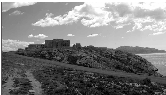
Hôpital Caroline, vue générale.