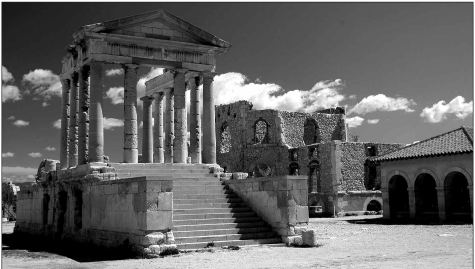
La chapelle de l'hôpital Caroline.

L'hôpital avait été construit sur une plate-forme surélevée, de telle sorte que le vent puisse chasser en permanence les "miasmes" responsables de la contagion. Pour ce faire, des ouvertures semi-circulaires aménagées dans la partie basse des bâtiments entretenaient un courant d'air permanent, l'air étant aspiré dans la partie centrale par un escalier à vis. À chaque angle de la cour et du chemin de ronde était installée une latrine. Chaque quartier disposait d'une citerne qui rassemblait les eaux de pluie récupérées à l'aide des chenaux et de conduites en terre cuite. Le nettoyage des planchers, des murs et des vêtements de malade devait se faire à l'eau de mer, puisée dans la calanque et trans-