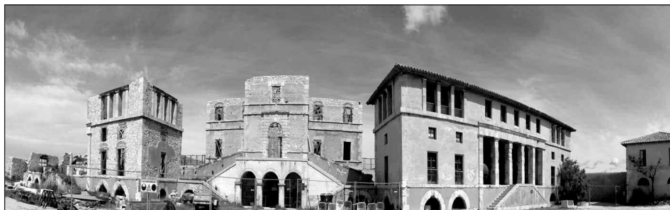
Hôpital Caroline. La capitainerie encadrée par les pavillons de convalescents.