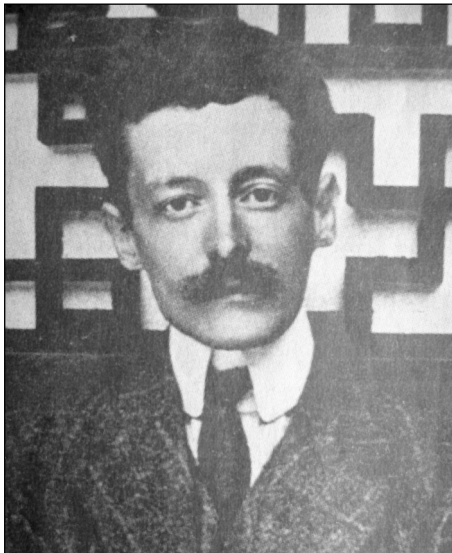
Portrait de Victor Segalen.

Victor Joseph Ambroise Segalen est né à Brest le 14 janvier 1878. Après des études au collège jésuite Notre-Dame de Bon-Secours à Brest, il intègre l'École principale du Service de santé de la marine à Bordeaux en juin 1898 mais très tôt s'intéresse à la littérature et à la musique, joue du piano, du violon et de l'orgue. Sa thèse de doctorat, le 29 janvier 1902, s'intitule "L'observation médicale chez les écrivains naturalistes".