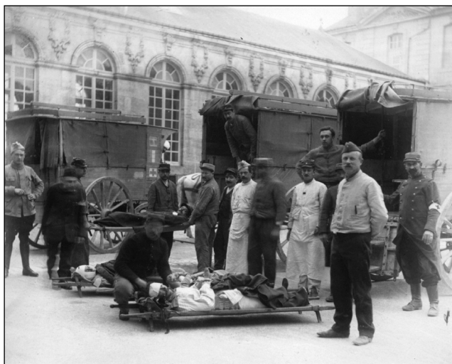
Fig. 5 : Evacuation des blessés : Hôpital N° 4.

gié, art dentaire). Peu à peu va se dégager, pour la prise en charge de ce type de blessure, une attitude thérapeutique comportant deux temps : - Traitement primaire : arrêt des hémorragies, maintien d'une ventilation au besoin par trachéotomie, parage "économique" de la plaie, alignement des fragments osseux autant que possible, irrigations abondantes à la solution de Carrel-Dakin, ce qui nécessitait un personnel infirmier extrêmement nombreux. - Évacuation secondaire sur l'arrière (souvent au Val-de-Grâce) pour le traitement des pertes de substance (Fig. 5).