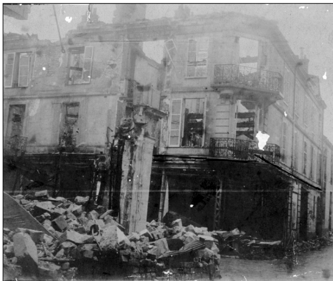
Fig. 6 : Reims bombardée.

Jean Prudhomme sera démobilisé en mars 1919. Comme pour beaucoup de chirurgiens, on s'aperçoit que leur activité a changé selon leur affectation. C'est ainsi que pour Jean Prudhomme, à Verdun, à l'ambulance 3 / 72, il avait une activité de chirurgie d'urgence ; à l'hôpital N° 4,