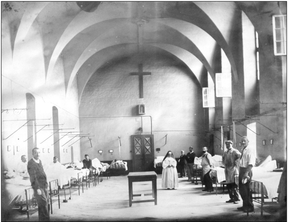
Fig. 2 : L'hôtel-Dieu de Reims.

Le texte débute au moment de la réussite de Jean Prudhomme au concours de l'externat. Très fier d'être le plus jeune candidat à avoir réussi, il écrit : "l'externat me donnait accès dans les services des "patrons", non plus comme simple stagiaire, mais comme externe, c'est-à-dire chargé de prendre les observations des nouveaux malades du service, de faire les analyses des radiographies les concernant, de faire quelques interventions de petite chirurgie, d'assister l'après-midi aux contre-visites de l'interne, et en l'absence de celui-ci, de les faire moi-même". On constate qu'il s'agissait en pratique d'un véritable temps plein, avec, à cette époque, priorité à l'enseignement "au lit du malade",