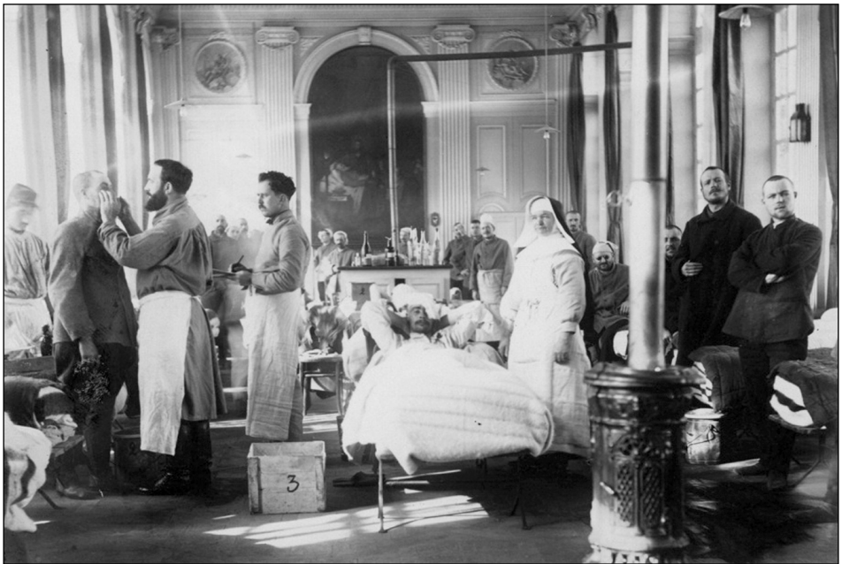
Fig. 4 : Service de chirurgie maxillo-faciale : Verdun, Hôpital N° 4.

Son activité sera celle des chirurgiens de la face de cette époque, prenant en charge les blessures par balles génératrices de fractures, souvent comminutives des maxillaires. Grâce à leurs compétences stomatologiques et dentaires, notamment leur connaissance de l'occlusion dentaire, de l'importance de l'alignement dentaire et des moyens de contention prothétiques ou par ostéosynthèses, plus tard aidés par les chirurgiens-dentistes et les mécaniciens dentistes, ils vont traiter ainsi un très grand nombre de blessés et faire progresser considérablement cette chirurgie. Quant aux lésions par éclats d'obus, qui représentaient en 1914 75 % des blessures faciales, elles posent des