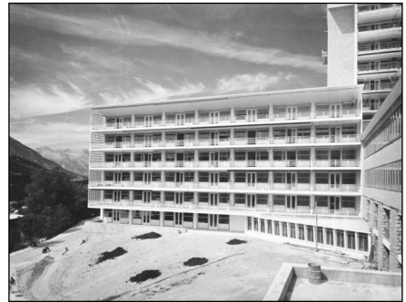
Fig. 4 : Rhône-Azur construit par la Sécurité sociale, 1955 - 1957