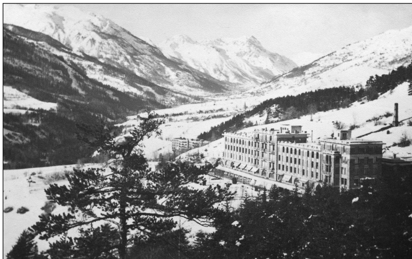
Fig. 2 : le Bois de l'Ours, 1930 - 1934