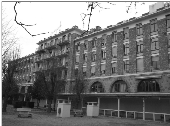
Fig. 5 : L'organisation et l'architecture du Bois de l'Ours