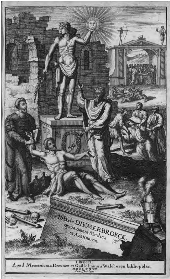
Fig. 1 : Frontispice des Opera omnia de Van Diemerbroeck, Utrecht, Meinard, 1685

plusieurs signes extérieurs des passions de l'âme, parmi lesquels l'éclat de rire et les larmes. Celles-ci, écrivait-il, "ne viennent point d'une extrême tristesse, mais seulement de celle qui est médiocre et accompagnée ou suivie de quelque sentiment d'amour, ou aussi de joie. Et, pour bien entendre leur origine, il faut remarquer que, bien qu'il sorte continuellement quantité de vapeurs de toutes les parties de notre corps, il n'y en a toute-