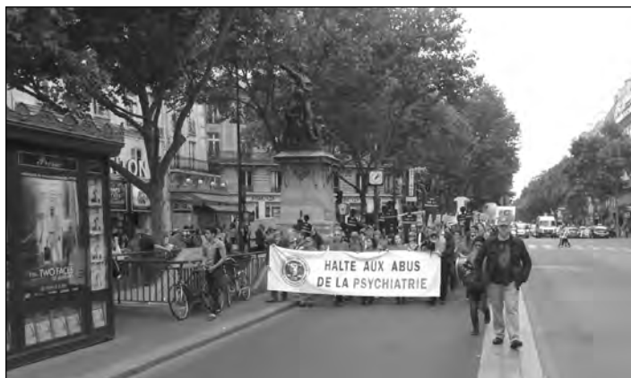
Aujourd'hui encore, l'après-midi du 14 juin 2014, boulevard Saint-Germain