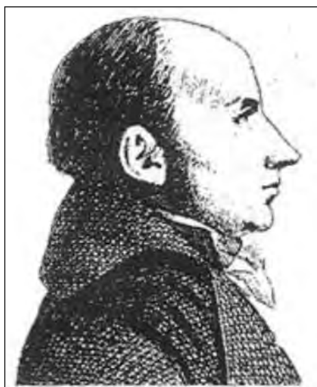
Fig. 1 : Portrait au trait de J.-P. Boudet, d'après Dutertre.

Jean-Pierre Boudet (Fig. 1) naît à Reims le 26 octobre 1748, dans une maison de la rue de Tambour où son père est maître sellier (Fig. 3). Il est baptisé dans la paroisse Saint-Hilaire de son quartier et la consultation de son certificat de baptême (Fig. 2) nous a permis de lever le doute que la littérature a entretenu sur son véritable prénom : il s'appelle Jean-Pierre, né de Jean-Baptiste Boudet son père, et de Marie-Claude Fripier. Son parrain s'appelait Jean-Baptiste, la coutume était répandue de rappeler le nom du saint patron, et ce sont sans doute les raisons pour lesquelles on le trouve souvent sous le nom de Jean-Pierre-Baptiste Boudet, comme c'est d'ailleurs inscrit sur sa pierre tombale récemment restaurée. Il n'a que huit ans lorsque son père meurt. Il étudie au collège des Bons-Enfants à Reims et montre des dispositions évidentes pour poursuivre des études. Mais sa mère