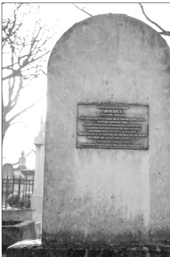
Fig. 5 : Sépulture de J.-P. Boudet au cimetière du Père-Lachaise.