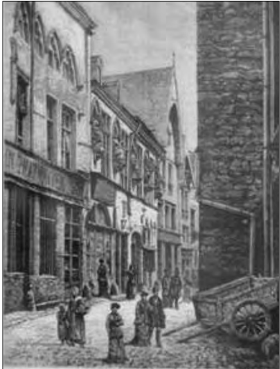
Fig. 3 : Gravure représentant la rue de Tambour à Reims. (Collection privée)

L'attraction de Paris et ses relations amicales avec Bayen et Parmentier le décident à y partir en décembre 1785, date à laquelle