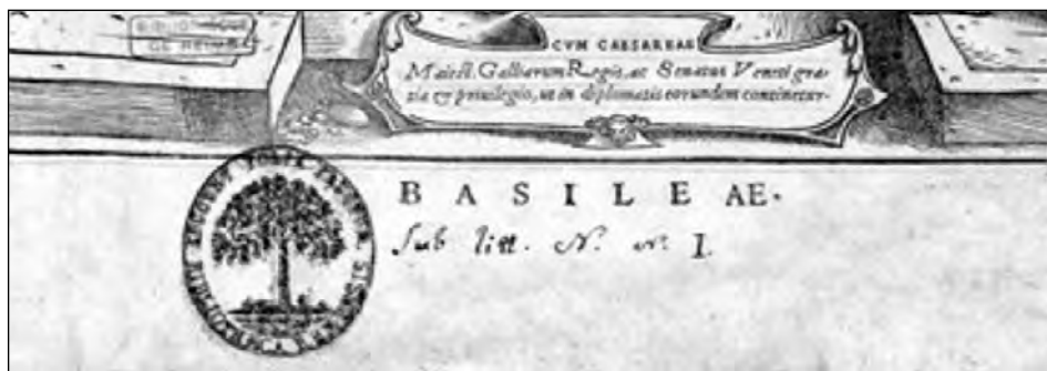
Fig. 7 : Le cachet révolutionnaire, preuve du vol !

Il reste à dire pourquoi ce couvent et son église avaient une place particulière pour la communauté des chirurgiens de Reims. La présence ancienne d'un autel pour le culte dévolu aux saints Cosme et Damien faisait que le 27 septembre de chaque année était célébrée la messe anniversaire de ces deux saints protecteurs, dite par l'un de R. P. Minimes jusqu'au 26 septembre 1726, où, pour imiter stupidement les chirurgiens parisiens (7), il fut décidé par la communauté des chirurgiens de Reims que les pères Cordeliers assureraient cet office d'autant que le couvent des Cordeliers de Reims était proche (7, 8).