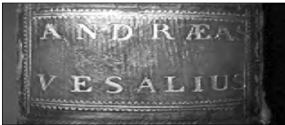
Fig. 1 : Reliure du début du XVIIème siècle.

Voici l'exemplaire de Reims dans une reliure sobre et solide de la fin du XVIème ou du tout début du XVIIème siècle (Fig. 1). L'état du livre est assez remarquable avec ce papier chiffon (6) du XVIème siècle dont Vésale lui-même vantait la qualité et la solidité, qui fait que ce bel in folio sera encore là quand bien des exemplaires du fameux traité de Bourguery et Jacob seront pulvérisés en raison même de l'acidité des papiers du