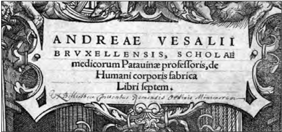
Fig. 3 : Inscription de provenance : Les Minimes de Reims.

d'Edouard Wotton (Fig. 4). En effet, ce livre porte les armes de Savigny et sur la couverture intérieure de ces De differentiis animalium libri decem de Wotton, on peut lire ceci : Ex dono Domini Domini Guillelmi de Vergeur, comitis de Saint Souplet puis Orate pro eo et Obiit die 16. januarii 1665 et au-dessus du titre : Ex bibliotheca conventus Remensis Ordinis Minimorum. 1605 Sub. Tout à fait surprenant avec la même graphie de deux p à Saint Souplet. Par deux fois, notons que Guillaume De Vergeur se voit inscrit dans le registre de l'obituaire qui renferme les grands bienfaiteurs et/ou des personnalités du couvent. Cela m'a poussé à regarder vers le fonds d'archives qui reste du couvent des