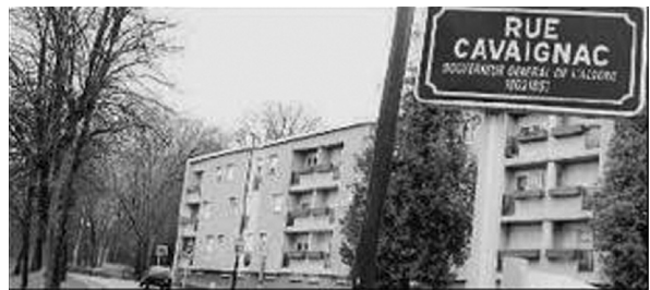
Fig. 4 : Remplacement à Metz du nom de la rue Cavaignac par celui de Raphaël Lévy en 2009.

Et c'est ainsi qu'à partir de quelques mots désinvoltes de Guy Patin, nous avons retracé l'histoire d'une erreur judiciaire qui a mis plus de trois siècles pour trouver enfin son épilogue.