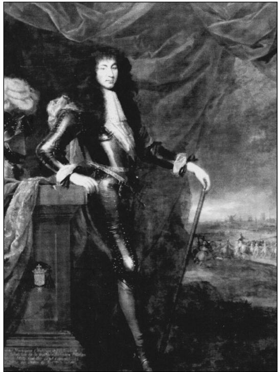
Fig. 3 : Portrait de Louis XIV en armure, 1665, par Louis Ferdinand Elle, Metz, musée des Beaux Arts.

C'est par lettres patentes que les rois Henri IV, Louis XIII, et Louis XIV, vont confirmer les ordonnances conférant aux Juifs ces privilèges, lors des visites qu'ils effectuent dans la ville de Metz en 1603, 1632, et 1657. Quand, le 25 septembre 1657, le roi Louis XIV, âgé de 19 ans, accompagné de son frère le duc d'Anjou, se rend à Metz, il est le premier souverain à visiter une synagogue. Dans la Correspondance de Guy Patin, on trouve bien la mention du voyage du roi à Metz et à Nancy (L 493 et L 494) (15). Mais, à l'exception des archives juives, la visite du roi à la synagogue messine n'est signalée nulle part (Fig. 3).