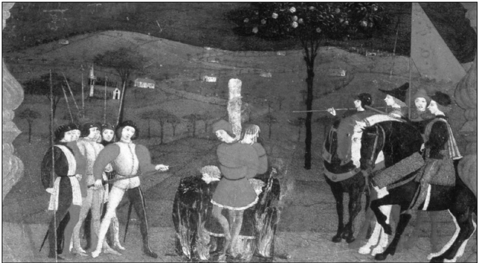
Fig. 1 : Miracolo dell'ostia profanata , da Paolo Ucello.

Selon Abraham-Nicolas Amelot de la Houssaye, "... les Juifs on toujours esté portez à ces sortes de crimes. Moise fut contraint de leur en faire une defence expresse dans l'Exode Chap. 21. Qui furatus fuerit hominem, et vendiderit eum, convictus noxæ, morte moriatur (III)". Cette croyance séculaire semble avoir débuté en 1144 en Angleterre, à Norfolk, après la mort du petit William assassiné à la veille de Pâques. Il s'ensuivit des pogroms dans tout le pays. Par la suite dans le reste de l'Europe, plus d'une centaine de Juifs furent accusés de ce meurtre rituel. En outre, ils étaient aussi accusés de "profanation de l'hostie" (10, 11) comme on peut le voir sur une prédelle peinte par Ucello vers 1467-1469 et initialement destinée à un retable pour l'oratoire de l'église du Corpus Domini d'Urbino (Fig. 1).