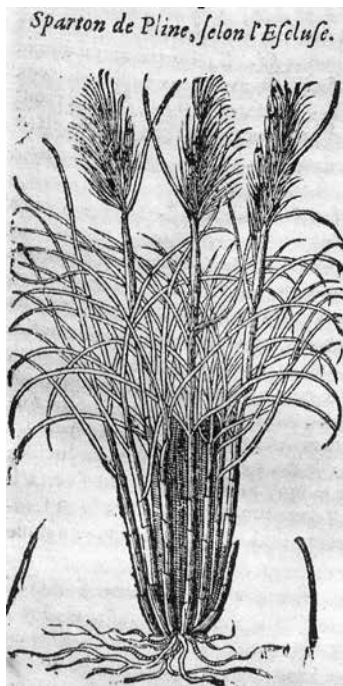
Fig. 3 - Exemple d'illustration d'un ouvrage botanique : planche de l'édition de 1653 de l' Histoire générale des plantes de Jacques Dalechamps (Bibliothèque universitaire historique de Médecine, Montpellier).

Le nom donné aux plantes, c'est-à-dire leur nomination, posait de plus en plus de problèmes au fur et à mesure que leur nombre augmentait, car chaque