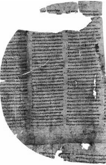
Traité sur les fièvres, papyrus extrait d'un cartonnage. P.Köln VIII 327 (inv. 20941).