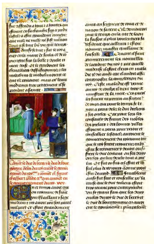
Fig. 2 - Chronique de Jean Froissart . B.N.F., Département des Manuscrits Français 2646, fol. 164.