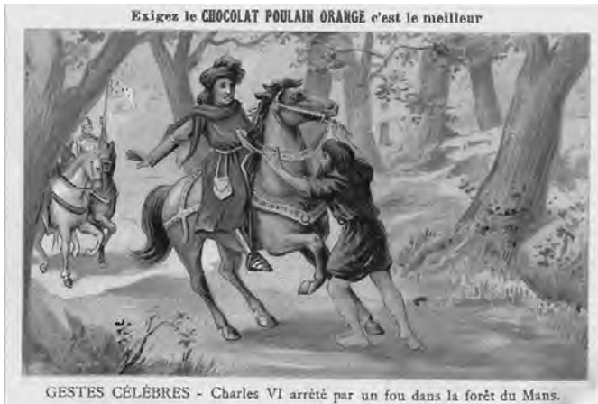
Fig. 1 - Gestes célèbres. Charles VI arrêté par un fou dans la forêt du Mans [Chocolat Poulain orange]

par foiblesse de chef. [...] et jà en voit le roi par le frénésie et foiblesse de chef perdu la connoissance, ni il ne savoit qui étoit son frère ni son oncle » : « le roi de France étoit enchez (tombé) par incidence merveilleuse en frénésie » [1, Livre IV, Chap. XXIX, pp. 88-94]. (Fig. 1)