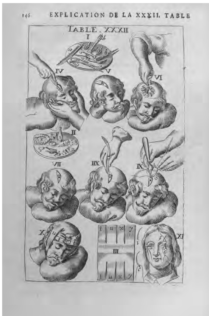
Fig. 5 - L'arsenal de chirurgie de Jean Scultet. Lyon, Ant. Cellier Fils, 1675, p.146, table XXXII

Cette troisième hypothèse a été défendue notamment par Bernard Guinée [25], qui parle même d'« ouverture de la boîte crânienne » et par Peter Gorzolla [26]. La perforation de l'os crânien est précédé d'une incision du cuir chevelu, ainsi que le recommande Ambroise Paré au XVI e siècle 7 , : Couper le cuir musculoux et pericrane qui entoure le test, et trepaner. (Fig. 5)