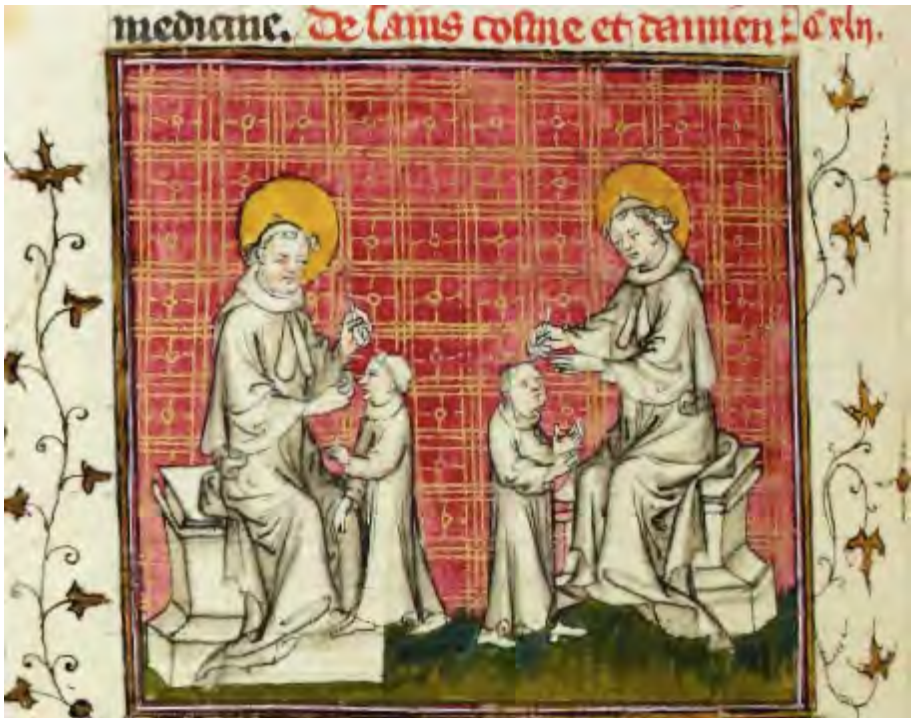
Fig. 3 - De sains cosme et damiens [Jean de Vignay, traduction de la Légende dorée de Jacques de Voragine, début du XV e siècle. B.N.F. Manuscrits français 242, fol. 217v, détail]