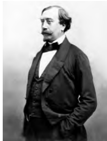
Fig. 4 - Portrait gravé de Louis Figuiier : coll. personnelle.

Une polémique a opposé Claude Bernard et Louis Figuiier (1819-1894) pharmacien, médecin et chimiste, agrégé de chimie à l'École de pharmacie (Fig. 4). Rappelons que ces deux médecins étaient concurrents pour un poste d'agrégé en physiologie et anatomie à la faculté de médecine de Paris : ils ont tous les deux échoué à ce concours. Figuiier va travailler expérimentalement pendant deux ans pour essayer de contredire les résultats de Bernard.