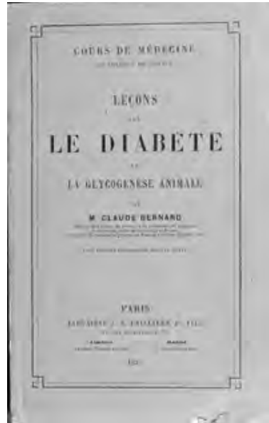
Fig. 6 - Leçons sur le diabète et la glycogénèse animale (1877) : coll. personnelle.

En 1876, un important travail critique complète les précédents 45 . Il admet enfin que « Le sang de l'homme et des animaux est invariablement sucré. J'ai montré que cette glycémie constante dépend d'une fonction normale du foie. » L'évolution chronologique de ses découvertes depuis vingt-sept ans, y est rappelée. Une première étude s'intéresse au fait que le sucre est un élément constant du sang, fonction physiologique réglée par le système nerveux. Différentes méthodes chimiques de détection du sucre dans le sang sont décrites et évaluées ; celle retenue est la coagulation du sang par le sulfate de soude combiné avec l'emploi du liquide de Fehling. « Chez l'animal vivant, la richesse sucrée du sang oscille constamment » ; mais si la proportion de sucre est sensiblement identique dans les divers troncs artériels, elle est un peu inférieure dans le système veineux. Le sang s'enrichit en sucre en traversant le tissu hépatique.