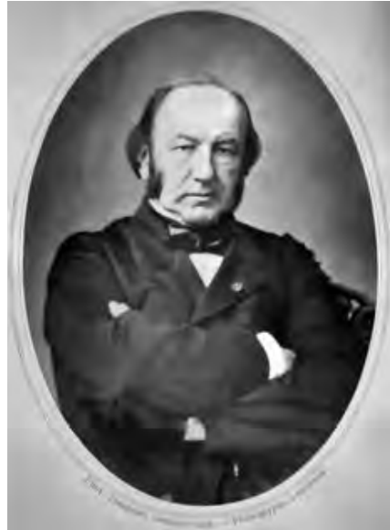
Fig. 1 - Portrait photographique de Claude Bernard (signé Trinquart, Gattiker succ.) : coll. personnelle.

Seuls les nerfs moteurs sont atteints dans l'empoisonnement par le curare, laissant la sensibilité intacte et les réflexes possibles. La paralysie des nerfs moteurs se fait de la périphérie au centre.