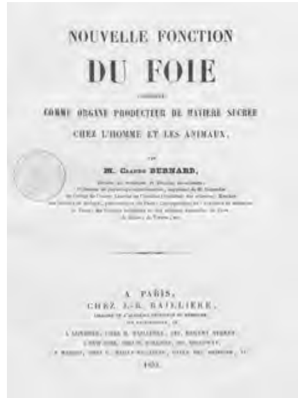
Fig. 2 - Nouvelle fonction du foie (1853) : cliché libre sur Gallica.

Les cours du semestre d'hiver 1854-1855 au Collège de France (où Cl. Bernard est professeur suppléant de Magendie) sont consacrés au foie, à la production de sucre et au diabète. La publication du premier volume des Leçons de physiologie expérimentale appliquée à la médecine faites au Collège de France a lieu en 1855 16 .